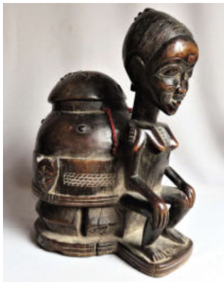
Een orakeldoos van de Baule.

De waarzegger lokt de muis naar boven door er rijstkorrels neer te leggen. De 'klant' houdt zijn wijsvinger op het