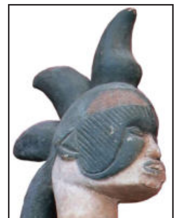
Afb 4. Een vrouwelijke alusi met een bijzondere kapsel.

De ronde stijl van de alusi uit het Noorden contrasteert sterk met die uit het Zuiden. Hier zien we een blokachtige weergave van lichaamsdelen met scherpe randen. In tegenstelling tot de beelden uit het noordelijke gebied komen hier ook moeder en kind combinaties in één beeld voor en groepen van figuren van verschillende afmeting, die de familie van de god vertegenwoordigen. In de oostelijke regio, die zich uitstrekt