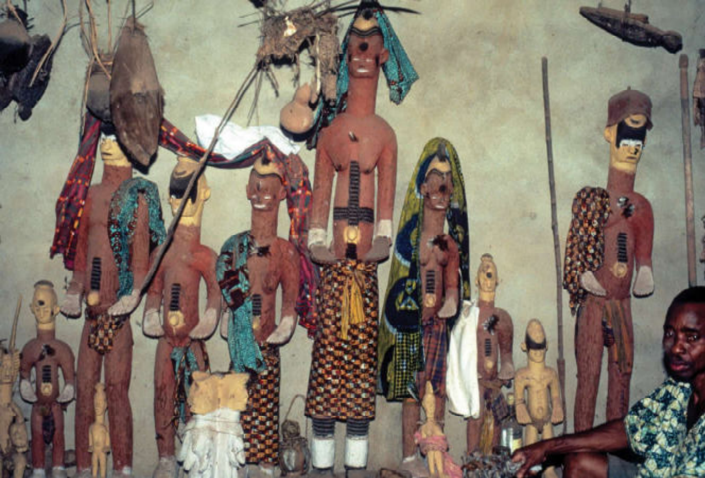
Afb 3. Alusi van de goden Udo en Ogwugwu met hun familieleden en een priester zoals opgesteld in een heiligdom in Okonkno Eze N'iru.

delijk met kalk, wit gemaakt. Wit, dat symbool staat voor zuiverheid. Bijvoorbeeld het niet van scarificaties voorziene deel van het gezicht en ook de onnatuurlijk grote voeten. Soms heeft het jarenlang opbrengen van kalk, nzu , en/of sandelhoutpoeder, nfi , ervoor gezorgd dat dikke lagen ontstaan zijn. De benen staan iets uit elkaar, de armen zijn los van het lichaam en heel karakteristiek, met vooruitgestoken handen en de handpalm naar boven. Op benen en armen zijn soms ringen weergegeven. Ze ver-