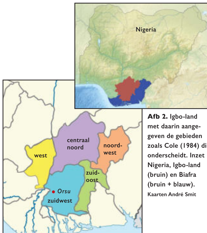
Afb 2. Igbo-land met daarin aangegeven de gebieden zoals Cole (1984) die onderscheidt. Inzet Nigeria, Igbo-land (bruin) en Biafra (bruin + blauw). Kaarten André Smit

De beelden waarop de beoordeling in het maartnummer betrekking had, zijn zogeheten alusi-figures. Alusi zijn de naar een menselijk evenbeeld doorgaans uit irokoehout ( Milicia excelsa ) gesneden beelden die een godheid voorstellen. Gebruikelijk is dat mannen en/of vrouwen worden weergegeven, maar ook kinderen. Hoe groter het beeld, hoe belangrijker de hieraan verbonden godheid. De alusi staan opgesteld in een huis voor