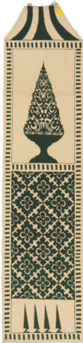
9. Lamak, gemaakt van gekleurd palmbiad (17 x 102 cm, RV-5258-106)