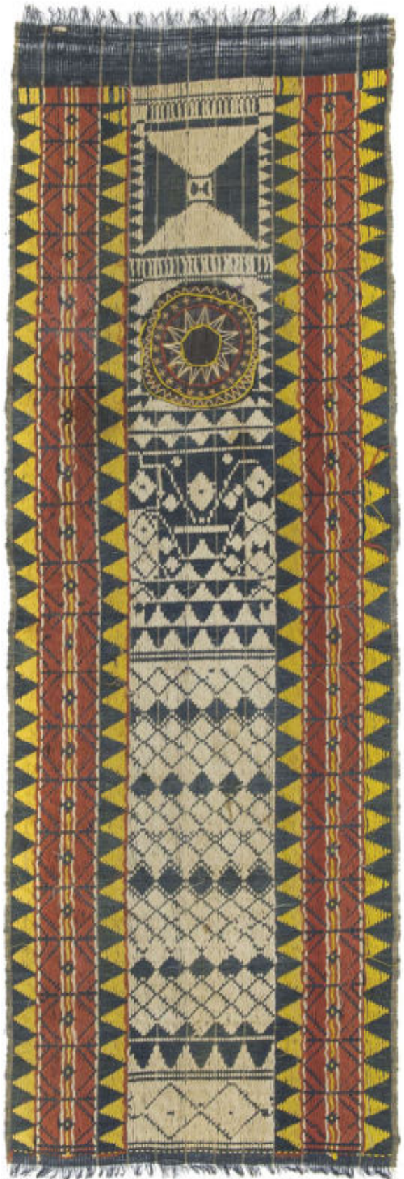
10. Lamak van beschilderd canvas (21 x 89 cm, RV-5258-50)