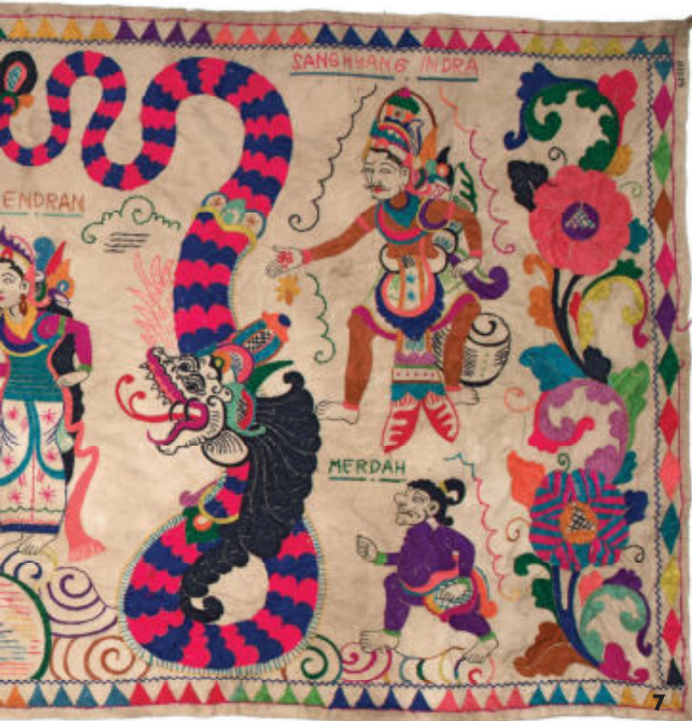
7. Geborduurde tabing met afbeeldingen uit het Arjunawiwaha verhaal (Jembrana, 90 x 232 cm, RV-7149-1)

tabing, die dateert uit de jaren 1970, en is gemaakt in Jembrana, West-Bali, zijn de hoofdpersonen van het verhaal niet geschilderd, maar geborduurd (afb. 7).