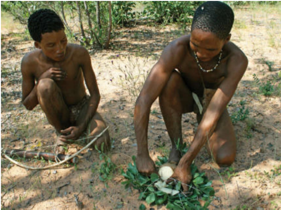
Het weefsel uit de wortelknol van Rhaphionacme velutina wordt bij waterschaarste uitgeknepen en levert dan enig (bitter) vocht op.