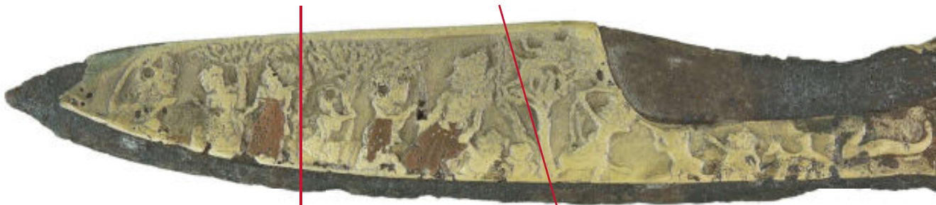
Hanuman en Sita en mogelijk Trijata