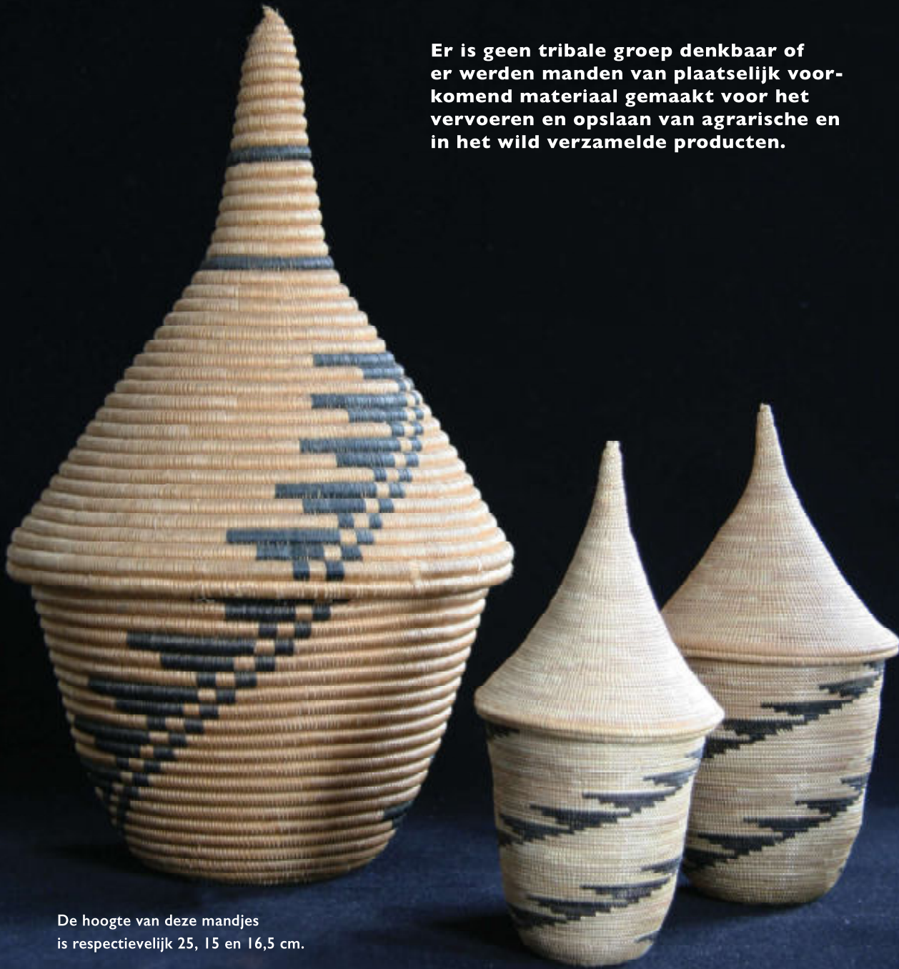
De hoogte van deze mandjes is respectievelijk 25, 15 en 16,5 cm.

Er is geen tribale groep denkbaar of er werden manden van plaatselijk voorkomend materiaal gemaakt voor het vervoeren en opslaan van agrarische en in het wild verzamelde producten.