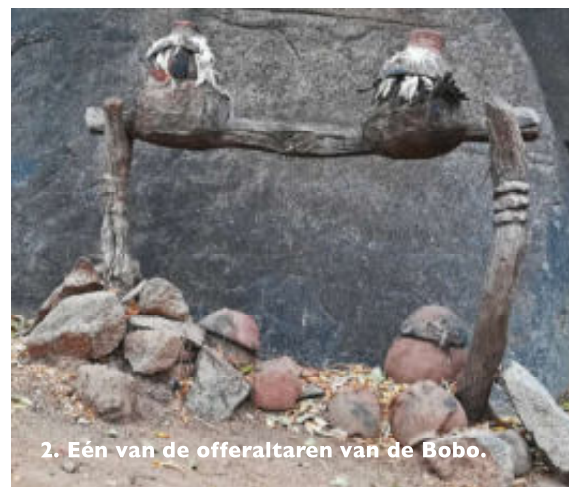
2. Eén van de offeraltaren van de Bobo.