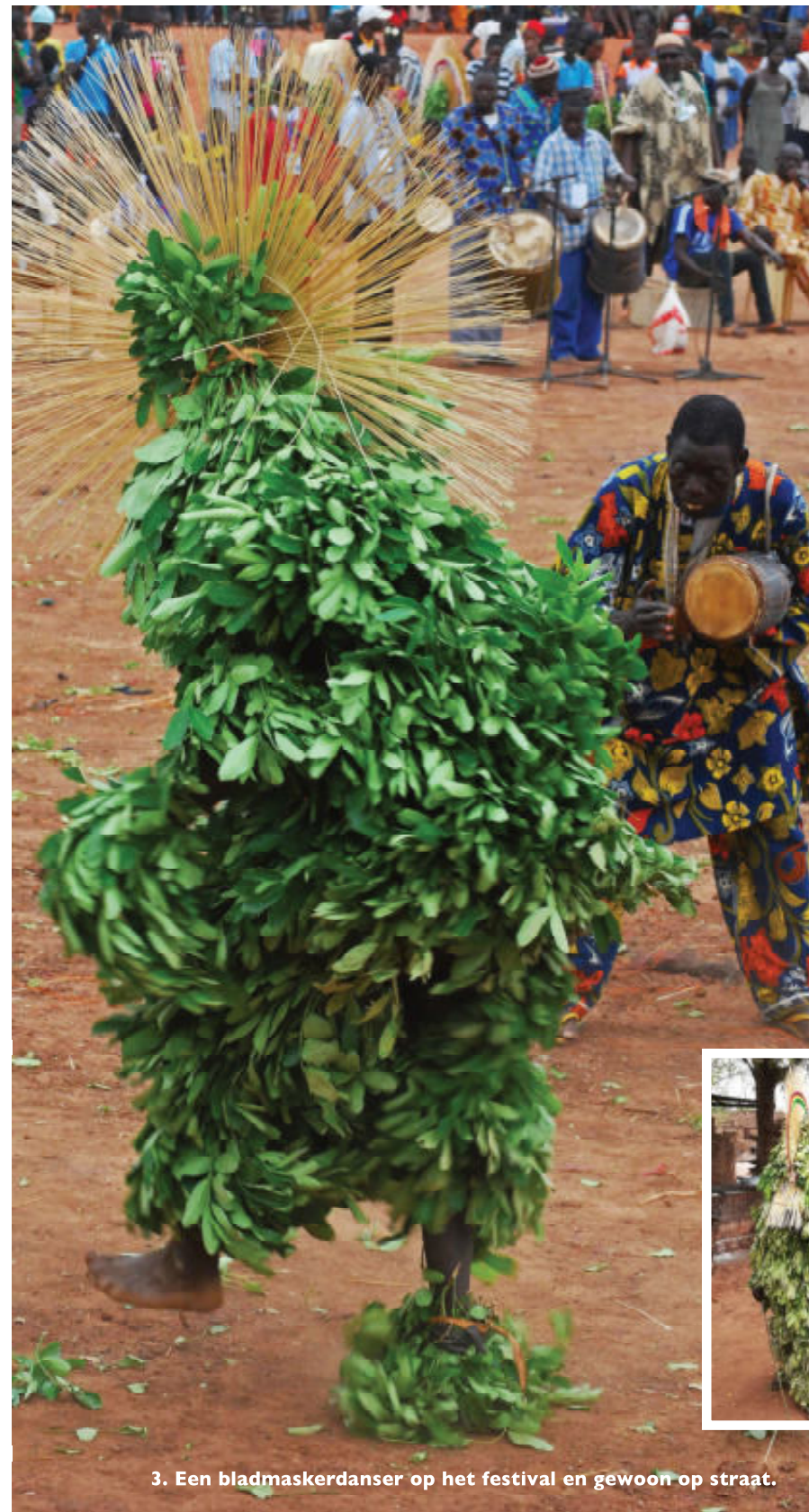
3. Een bladmaskerdanser op het festival en gewoon op straat.