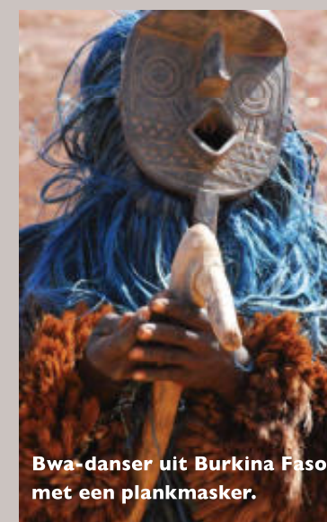
Bwa-danser uit Burkina Faso met een plankmasker.

Bovenop komt een soort kam van gedroogd gras ( Loudetia togoensis ). Deze kam wordt bwosonu genoemd.