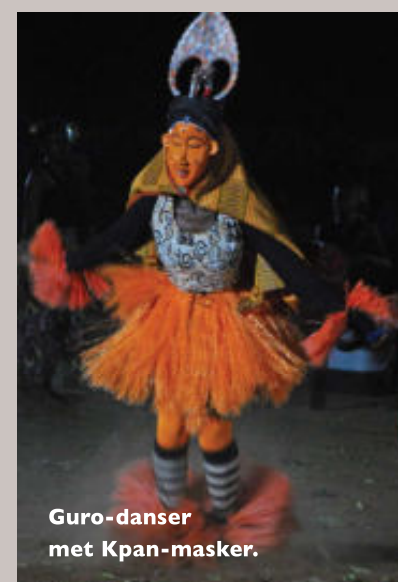
Guro-danser met Kpan-masker.