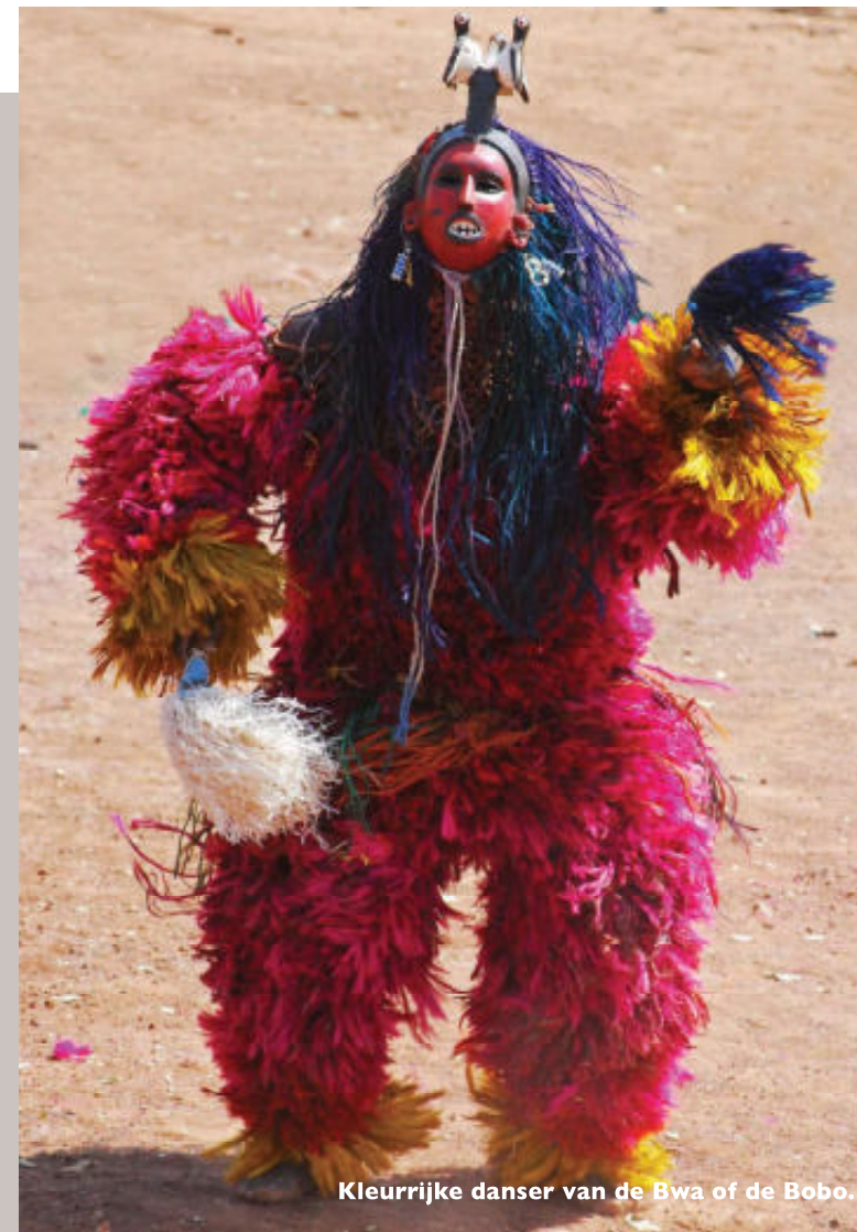
Kleurrijke danser van de Bwa of de Bobo.