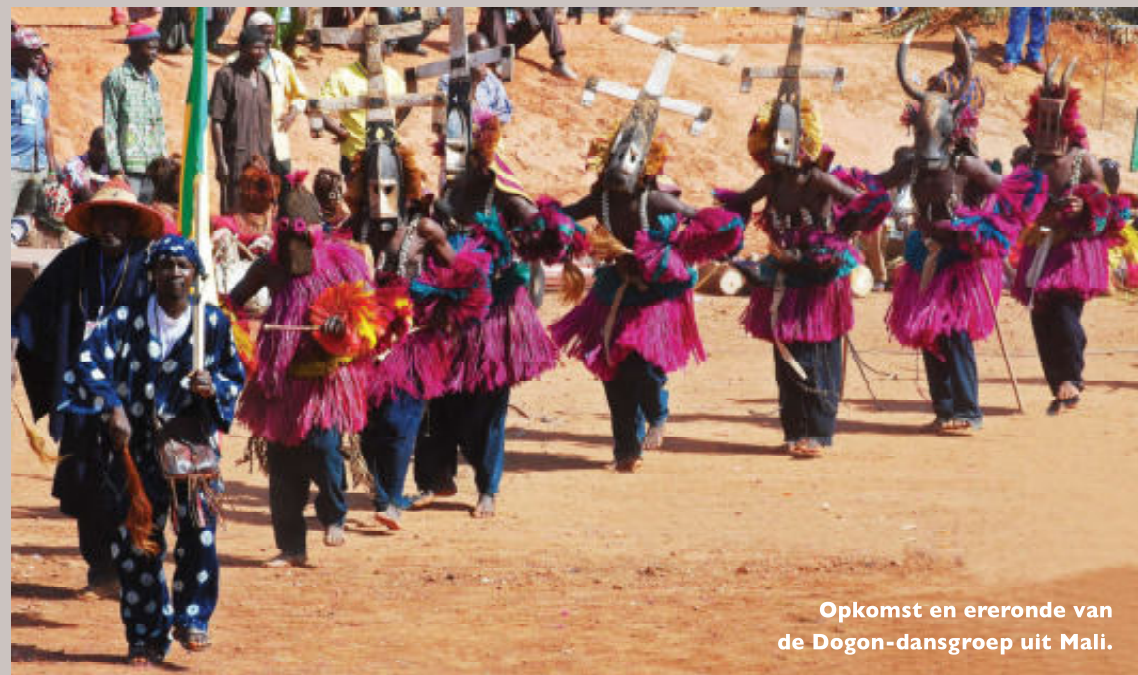
Opkomst en ereronde van de Dogon-dansgroep uit Mali.

De groep die aan de beurt is maakt een soort ereronde alvorens het kleurrijke optreden gaat beginnen. Elk optreden van welke stam ook duurt minimaal 25 minuten en loopt vaak uit.