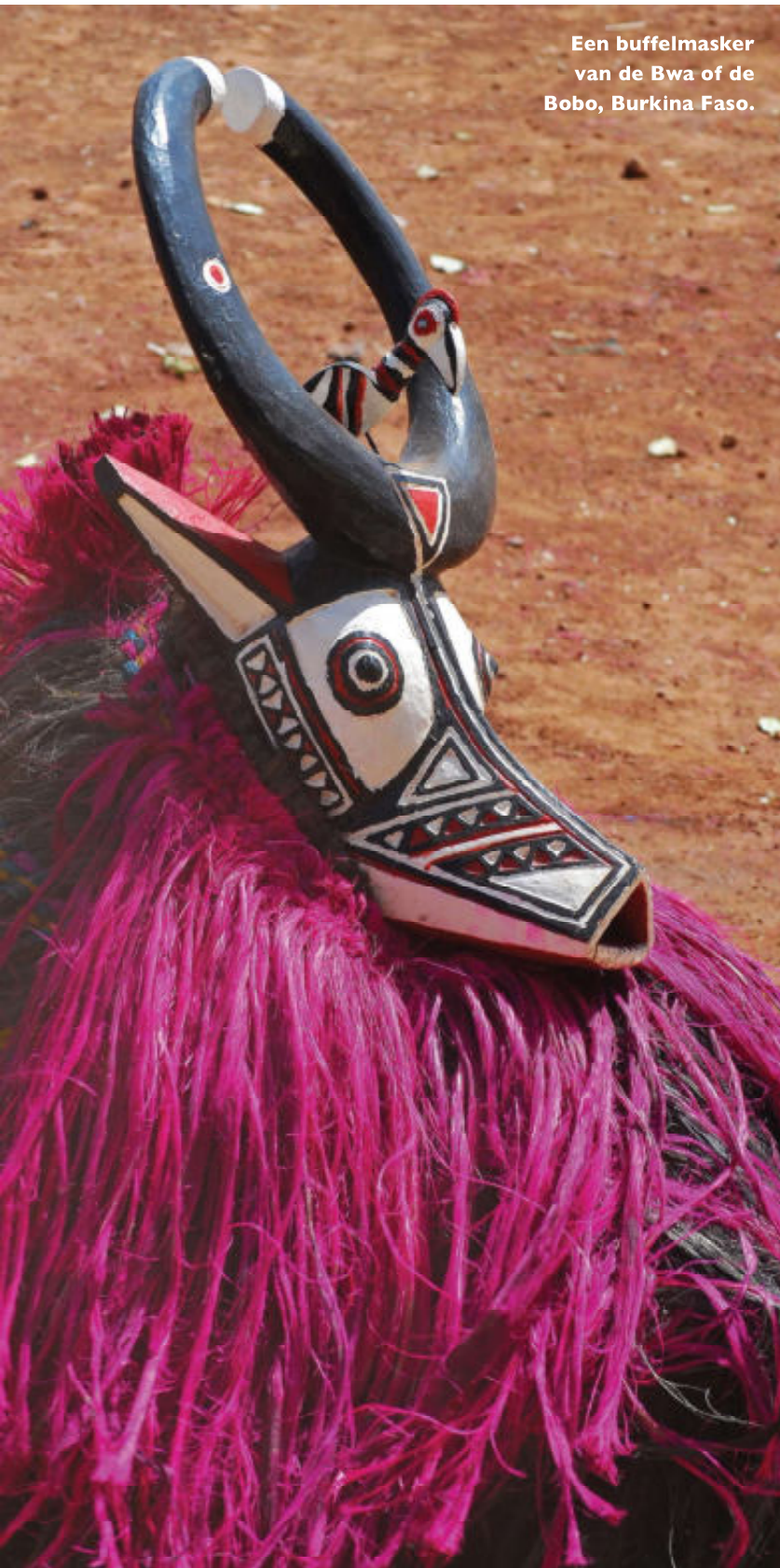
Een buffelmasker van de Bwa of de Bobo, Burkina Faso.

Deze gewoonte gaat teug naar de mythe dat Wuro voor het eerst verschenen is aan een kind.