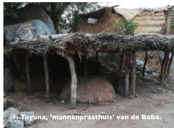
1. Toguna, 'mannenpraathuis' van de Bobo.

Lokale koningen hebben wel aanzien maar geen directe invloed op de politiek.