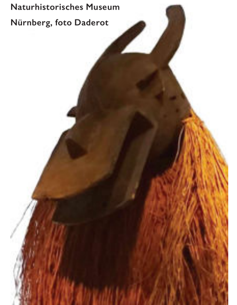
Een danser van de Chamba uit Nigeria in een kostuum, gemaakt van plantaardige vezels en een buffelmasker met duidelijk antropomorfe kenmerken (let op de neus!). Naturhistorisches Museum Nürnberg

voor de ogen en versierd met veren van een roofvogel. Vroeger werd ook boomschors gebruikt. Het gelaat kan ook onbedekt zijn. De juju draagt dan een pruik van mensenhaar en een hoedje versierd met knopen, kralen, horens, enz. De houten maskers zijn altijd figuratief en kunnen zoals reeds gezegd antropomorf, zoömorf of gemengd zijn. Ze worden gedragen als gelaatmasker of als helm masker. Er bestaan verschillende juju's met elk hun specifieke betekenis en taak. Hun optreden gaat vergezeld van een eigen choreografie, muziek, liederen en kreten, afhankelijk van hun functie. Soms wordt de stem veranderd of spreken ze een geheimtaal die bij een van de geheime genootschappen hoort. Een groot blad aan de kap bevestigd toont dat de