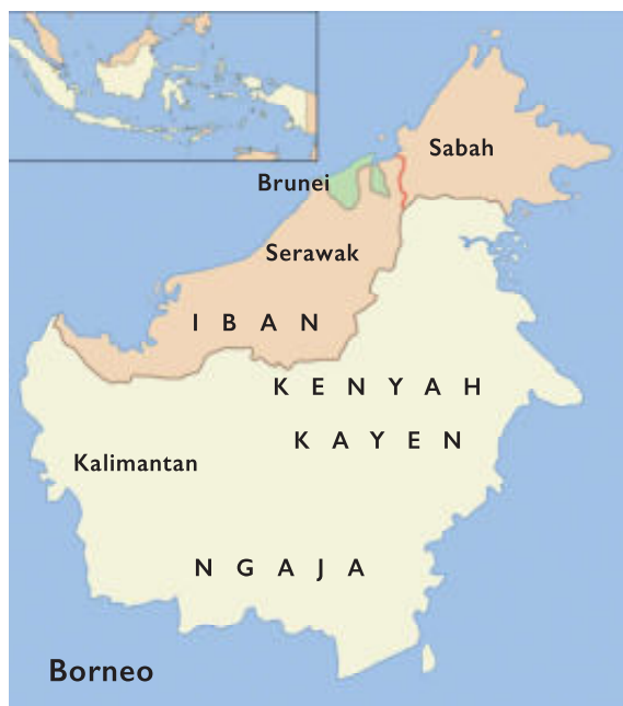
Borneo met de staatkundige indeling waarop de woongebieden van de Iban, Kenyah en Kayen en de Ngaju globaal zijn weergegeven.

In 1980 bedroeg de totale bevolking van Borneo slechts tien miljoen mensen waarvan drie miljoen tot de Dayak behoorden. Dayak is een collectieve naam voor tientallen volken, stammen en groepen en zijn naast de Punan – bosnomaden die vasthouden aan oude religies – de oorspronkelijke bewoners van Borneo.