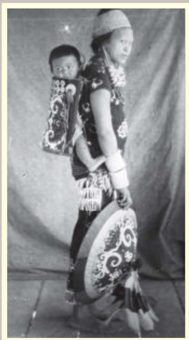
5. Aso-motieven op hoed en draagstoeltje.