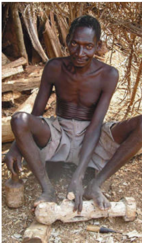
Houtsnijder van de Fon

Roka, Natal-mahonie ( Trichilia emetica )