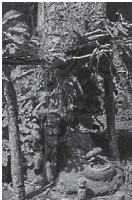
Beeld van Legba en Bochio's onder een afdak van takken en bladeren.

Sommigen Bochio's hebben een spitse onderkant en soms een ijzeren pin om ze de aarde in te kunnen drijven. De verbinding met de grond geeft ze de kracht om de toegang van kwade geesten te verhinderen.