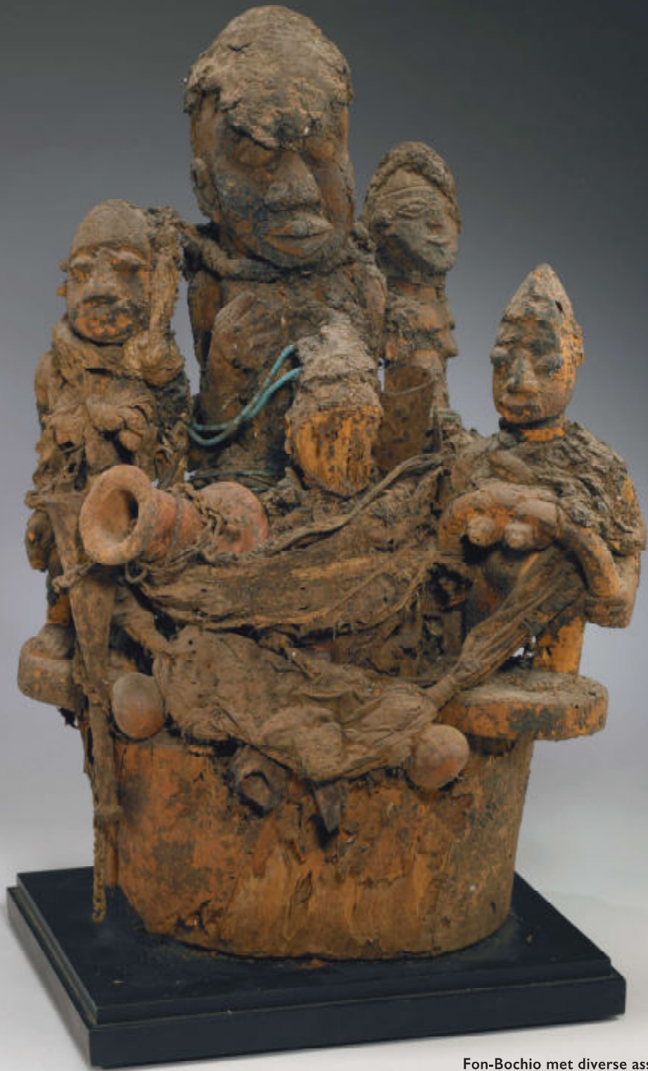
Fon-Bochio met diverse assemblages (36 x 27 x 25 cm)