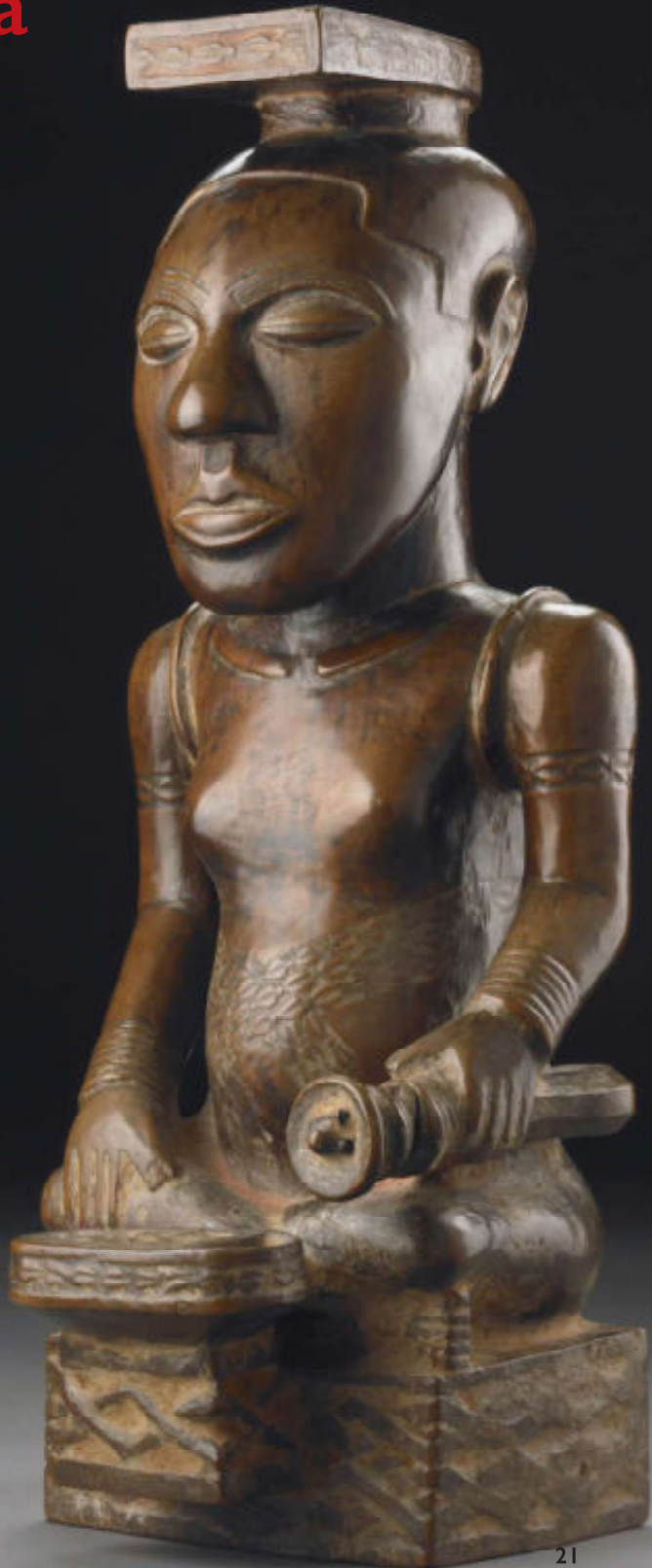
Ndop (beeld) van koning Shyaam aMbul aNgoong

De Kuba hebben in de loop der eeuwen een klein aantal indrukwekkende beelden voortgebracht, die door hen Ndop werden genoemd. Deze beelden worden tegenwoordig tot de top van de Afrikaanse kunst gerekend. Ze bevinden zich voornamelijk in musea. Het Brooklyn Museum in New York heeft een exemplaar, het British Museum in Londen bezit er drie en het AfricaMuseum in Tervuren is eigenaar van twee eeuwenoude Ndop-beelden.