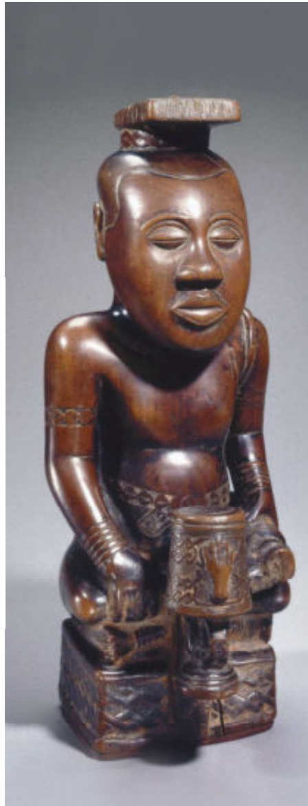
Ndop (beeld van koning Mishe miShyaang maMbul met ibol (als persoonlijk symbool) een drum met een afgehakte hand. DRC, ca. 1760-1780, h 49,5 cm.