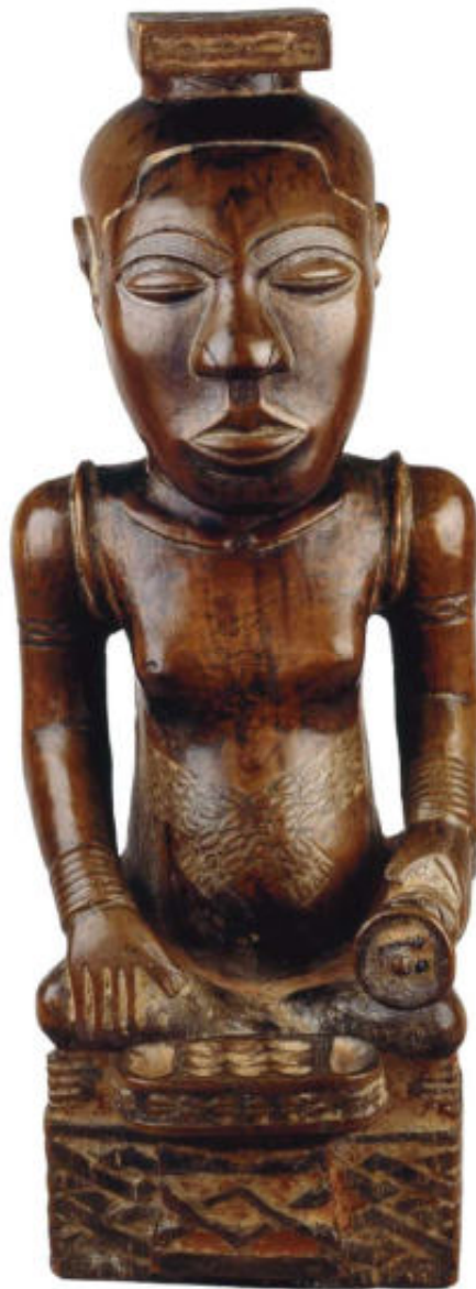
Ndop (beeld) van koning Shyaam aMbul aNgoong met als ibol (persoonlijk symbool) een bordspel. DRC, laat 18e eeuw, h 55 cm.

De beelden tonen de vorst in kleermakerszit – redelijk uitzonderlijk voor