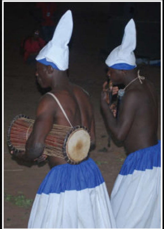
De Zara-dansers worden begeleid door trommels en fluiten.