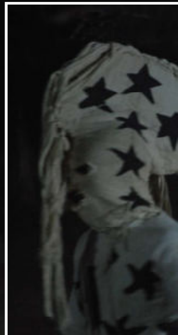
Kunkuli, de vijfde danser, heeft een masker met lange katoenen lokken.