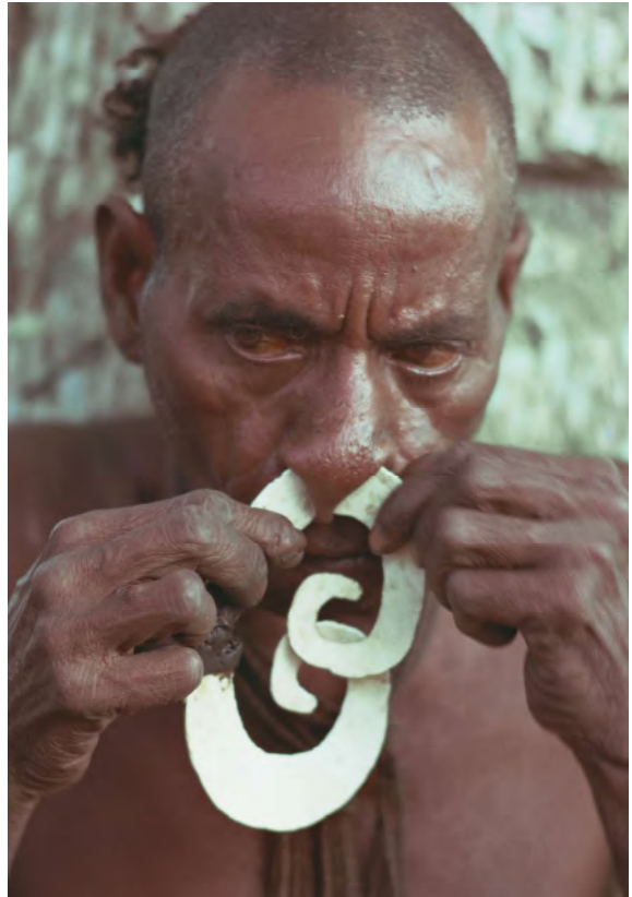
Een Asmat-man bij het aanbrengen van een Bipane.

dat wanneer iets te mooi lijkt om waar te zijn, dan is dat vaak ook zo! Aanschaf via gerespecteerde handelaren en/of met een verifieerbare herkomst voorkomt teleurstelling achteraf.