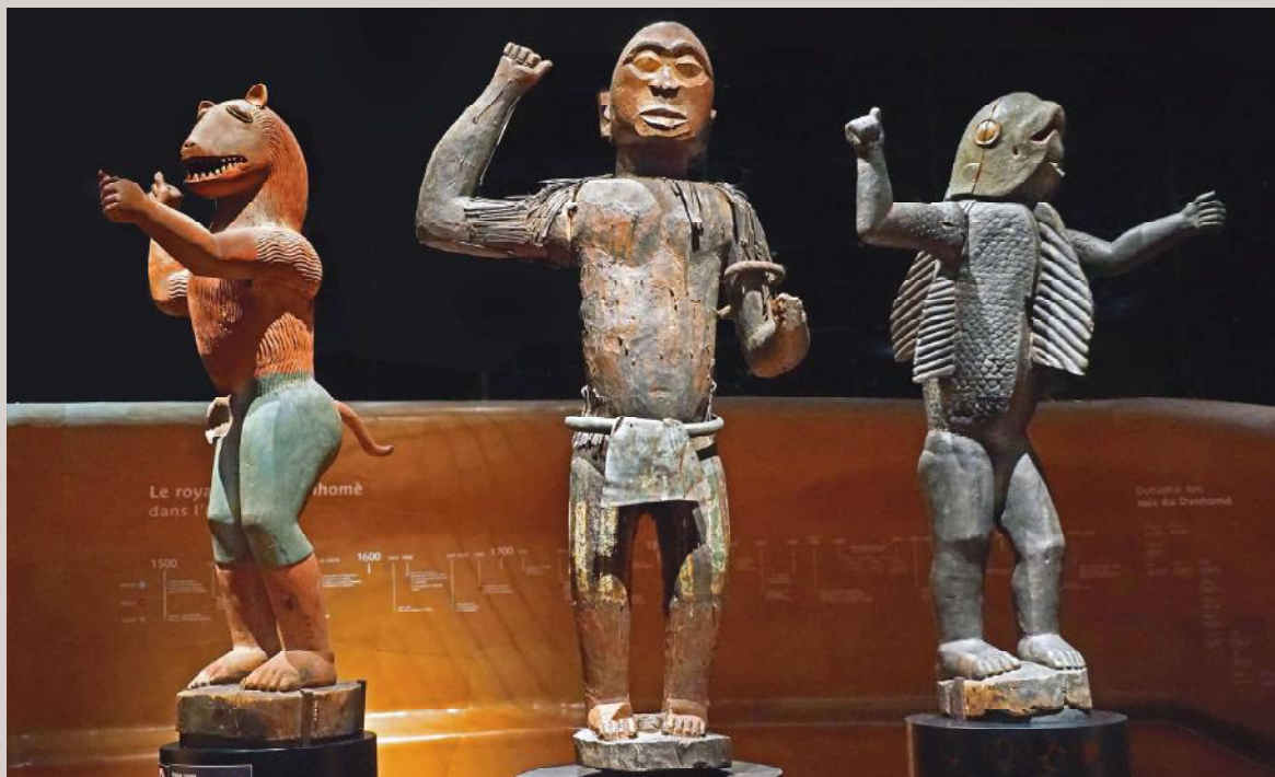
Drie door het Franse leger buitgemaakte beelden waarvan de Franse president heeft aangegeven dat ze moeten worden teruggegeven. Ze bevinden zich nu in museum Quai Branley Jacques Chirac, Parijs. Vlnr: het beeld met een leeuwenkop (225 cm) dat staat voor het rijk van koning Glélé (1858-

Daarnaast bestaat er nog het CITES-verdrag, dat de handel regelt in producten van bedreigde soorten, zoals ivoor, haar, pluimen, eieren. CITES staat voor Convention on International Trade in Endangered Species of wild flora and