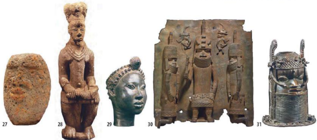
27. Laterite Taha (sculpted head) with flat top, nose and mouth sculpted in relief, Gohitafla, pre-17 th c. AD, 26.5 x Ø 19 cm.