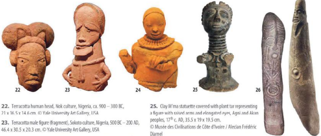
22. Terracotta human head, Nok culture, Nigeria, ca. 900 – 300 BC, 71 x 16.5 x 14.6 cm.

Bearded men. Women with smooth or sculpted hair, with chignons or braids. Arms extended alongside the body, bent or folded across the chest. Drooping breasts. Scarified body. Prominent navel. May be wearing jewellery or accessories, sometimes sculpted on the material itself. [22–23–24–25–26–27–28–29–30–31]