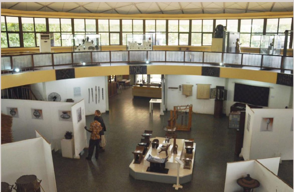
Links: Een uit ca. 1900 daterend opzetmasker in de vorm van een slang (Baga, Guinee) in Museum Rietberg, Zürich.

Ook de evolutie van de Afrikaanse landen naar moderne en onafhankelijke staten heeft de verkoop in de hand gewerkt en de handel in cultuurobjecten gestimuleerd. Waar de nieuwe generaties meer geïnteresseerd waren in verbruiksgoederen (radio, TV, [brom-]fietsen), had ook de overheid geld nodig om uitgaven, zoals de aanleg van wegen, te financieren. Men kan dus stellen dat beide partijen, kopers en verkopers, maar al te goed op de hoogte waren van wat ze verhandelden en dat de Afrikanen hier bewust deel van uitmaakten. Het machtsverschil tussen rijk en arm speelde zeker niet alleen tussen rijke Europese kopers en arme Afrikanen, maar evenzeer tussen de Afrikanen