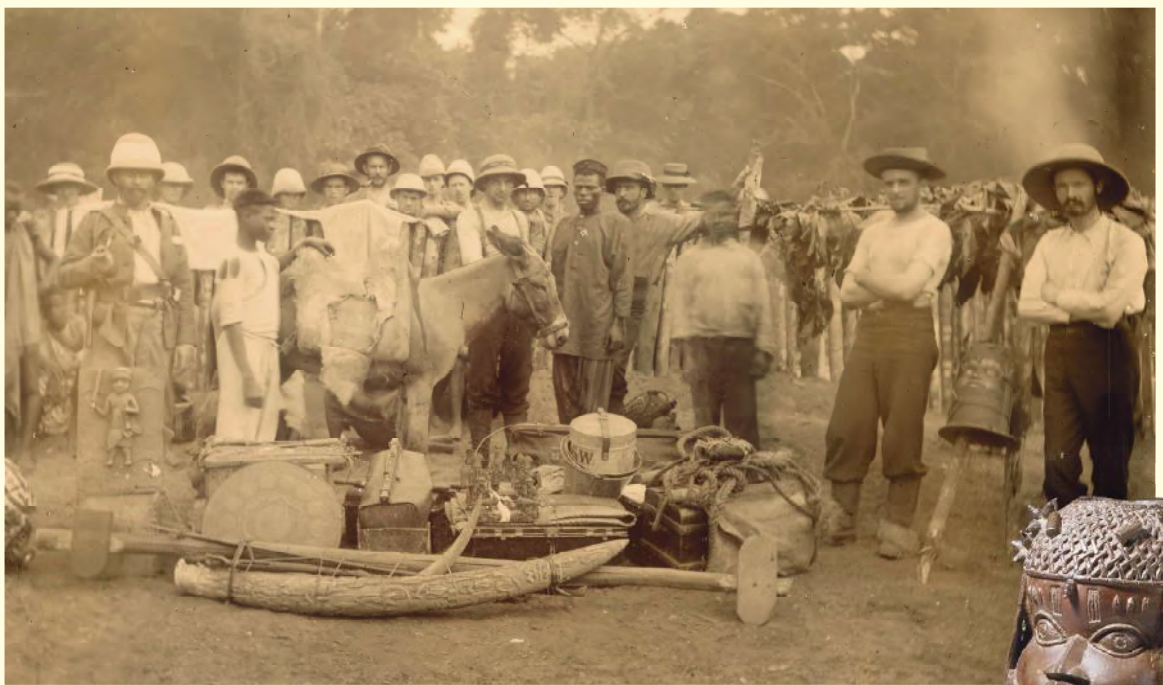
Benin expeditie 1897. Groep Europeanen met een verzameling van Benin-objecten.

noodzakelijke voorwaarden moeten worden geschapen om alle Afrikaans patrimonium tijdelijk of definitief terug naar Afrika te brengen. Daar is heel wat reactie op gekomen, zowel pro als contra.