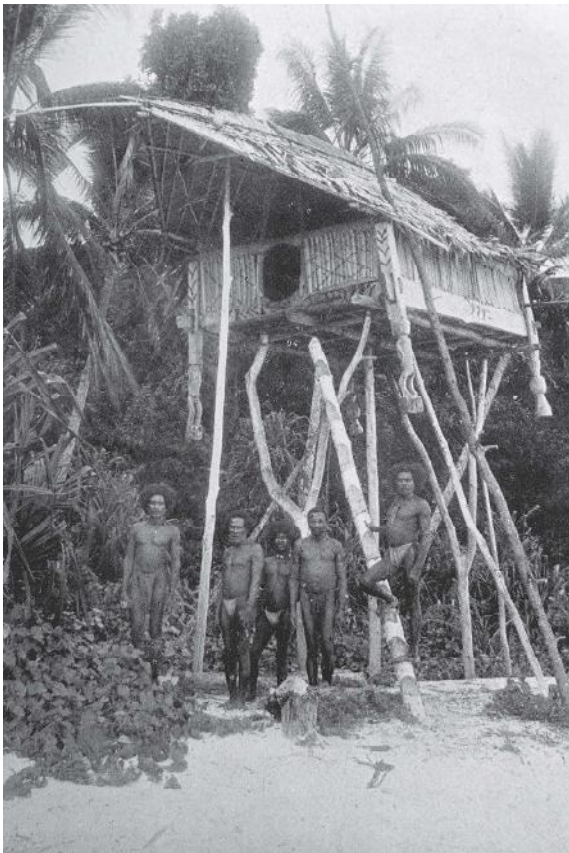
Een klein (ongehuwde-)mannenhuis met geestenbeelden op Meos Bepondi. Op dit eilandje deponeerden meerde Biak clans hun doden.