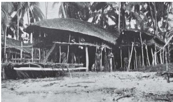
Wari, een nederzetting aan de noordkust van Biak.

RC: Ook over de veel zeldzamere grote geestenbeelden ( mons ), over de amuletten, trommen, voorstevens, schilden, enzovoort. En via die rituele voorwerpen over het traditionele, vóór-Christelijke wereldbeeld en de oude rituelen. Daarbij draait alles om het onderhouden van relaties met de wereld van geesten - vooral de recent overledenen, maar ook de verre, totemistische, vaak als slang voorgestelde oer-voorouders. De geestenhuisen - rumsrams , een soort tempels - waarmee de zendingen in de loop van de tweede helft van de 19de eeuw korte metten maakten, komen ook aan de orde. Verder onder meer een aantal vroege verzamelexpedities en de zendingstentoonstellingen in Nederland waarop korwars verkocht werden.