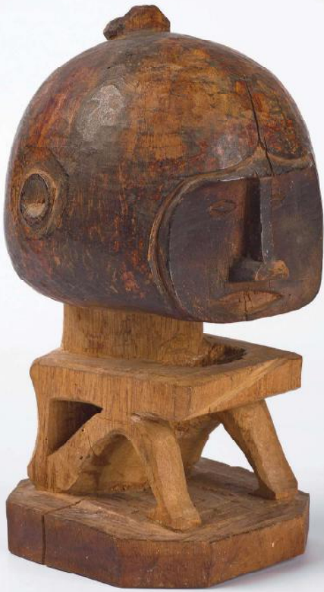
Een vrouwelijke korwar (h 20 cm) uit het noorden van de Raja Ampat archipel, het meest westelijke korwar-stijlgebied. Dit is één van de slechts enkele tientallen korwars die de zendeling F.C. Kamma aldaar in- of afnam gedurende de jaren 1930.

Nationaal Museum van Wereldculturen, WM-28225