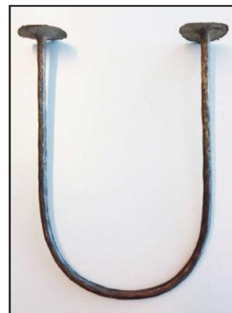
Links: Een gesmeed ijzeren betaalmiddel, iwenga, van de Nkutshu.