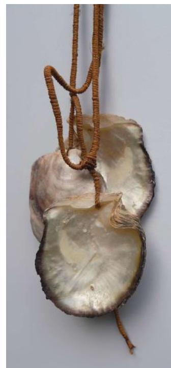
Yap, geld van parelmoerschelpen ( Pinctada maxima ).

Rond 1900 was een steen van 30 cm in omvang een varken waard, rond 1940 ca. $75 en rond 1965 nog slechts $30. De stenen werden overigens vooral gebruikt voor ceremoniële en politieke betalingen.