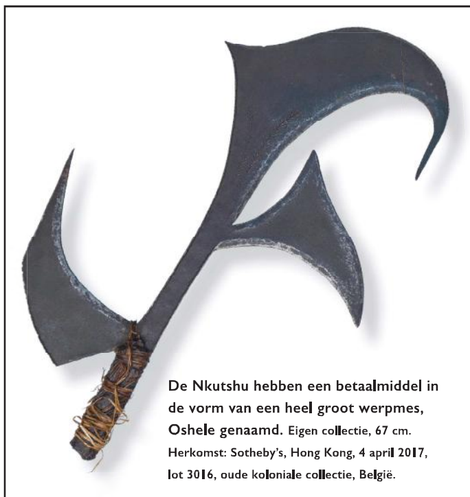
De Nkutshu hebben een betaalmiddel in de vorm van een heel groot werpmes, Oshele genaamd. Eigen collectie, 67 cm. Herkomst: Sotheby's, Hong Kong, 4 april 2017, lot 3016, oude koloniale collectie, België.

De oshele was de hoogste geldvorm bij de Nkutshu. Het geldsysteem bestond verder uit de konga of 'olifantsrib' en de iwenga. De iwenga diende voor de reguliere betalingen, 60 iwenga was gelijk aan één konga en 500 iwenga stond gelijk aan één oshele.