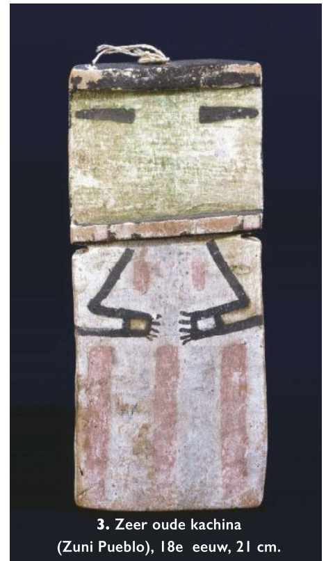
3. Zeer oude kachina (Zuni Pueblo), 18e eeuw, 21 cm.

De Kachina's zijn gemaakt van de wortels van een plaatselijk voorkomende populierensoort, Populus fremontii , een lichte, makkelijk te bewerken houtsoort. Ze worden beschilderd en kunnen allerlei