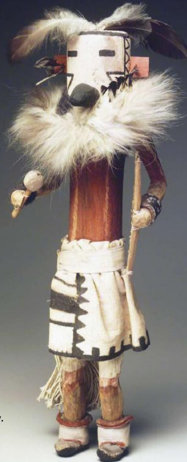
8. Zakyalestoy. (Zuni Pueblo), laat 19e eeuw, 44,5 cm.