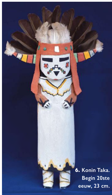
6. Konin Taka. Begin 20ste eeuw, 23 cm.

Elke pop is uniek, de poppen worden niet in serie gemaakt. Er zijn wel meerdere poppen die allemaal eenzelfde geest voorstellen. Deze poppen hebben echter wel allemaal de vaste kenmerken, die bij het uitbeelden van die Katsina horen.