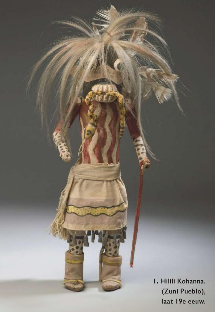
1. Hilili Kohanna. (Zuni Pueblo), laat 19e eeuw.