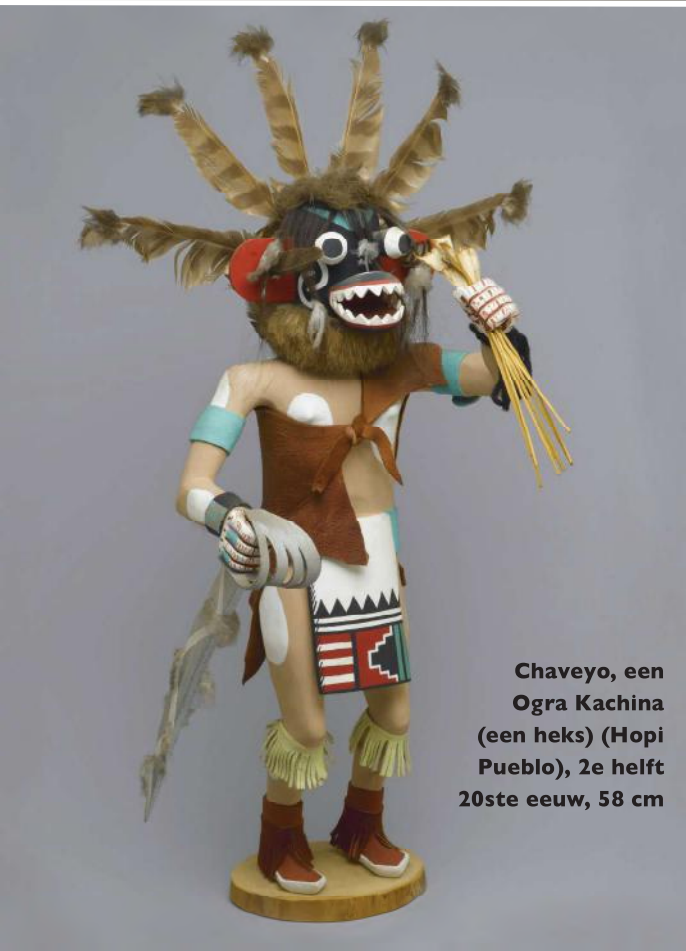
Chaveyo, een Ogra Kachina (een heks) (Hopi Pueblo), 2e helft 20ste eeuw, 58 cm