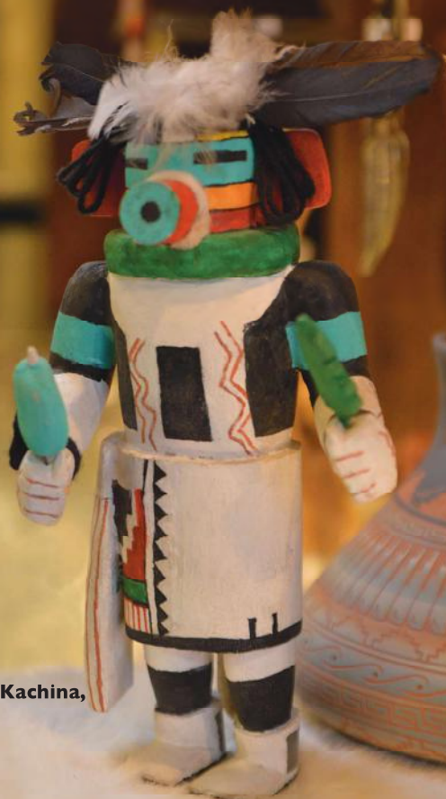
9. Corn Kachina, 27 cm.