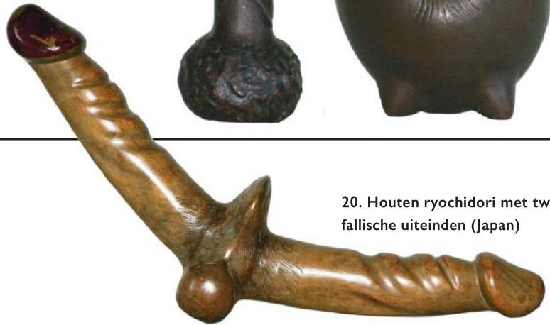
20. Houten ryochidori met twee fallische uiteinden (Japan)