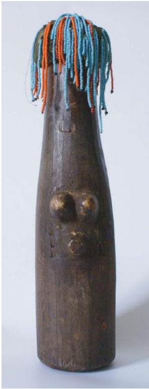
4. Houten pop met fallische vorm en vrouwelijke kenmerken. (Dinka, Zuid-Soedan)