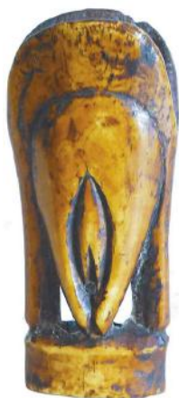
15. De vrouwelijke zijde van het ivoren ritueel object met een mannelijke zijde in Januspositie.

Bij de Makonde, een etnische groep uit Tanzania en Noord-Mozambique, zijn de rituelen in verband met vruchtbaarheid zeer manifest aanwezig en objecten die