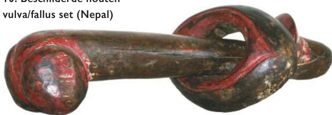
10. Beschilderde houten vulva/fallus set (Nepal)