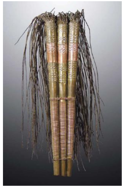
23. Koperen pseudofallus. Met dit attriboot willen de vrouwen aandacht van de man trekken (Kapsiki, Kameroen/ Nigeria)

parfum kan aangebracht worden. Uit Japan zijn echter nog meer voorwerpen bekend die vrouwelijke en mannelijke elementen verenigen. Een fraai voorbeeld is de ryochidori (dubbeldildo), die gebruikt werd in het kader van een lesbische dan wel vrouw-vrouw relatie (afb. 20). Dit houten object is ook afgebeeld op de shunga (houtdrukken met erotische thema) (afb. 21 en 212).