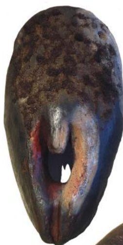
17. Complementair houten mannelijk en vrouwelijk genitaal, gedecoreerd met mensenhaar (Makonde, Tanzania/Mozambique)