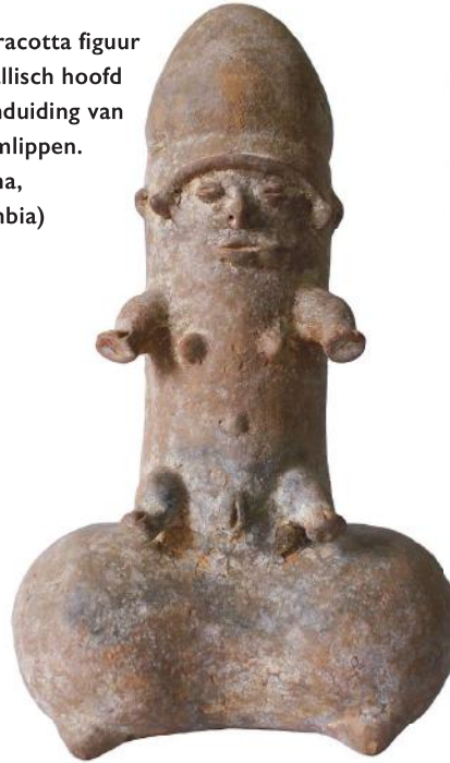
5. Terracotta figuur met fallisch hoofd en aanduiding van schaamlippen. (Calima, Colombia)