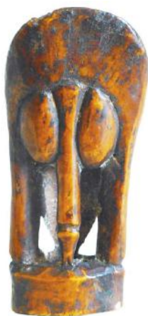
15 Ivoeren ritueel object met een mannelijke en vrouwelijke zijde in Januspositie. Hierboven de mannelijke kant, op pagina 23 de vrouwelijke zijde. (Lega, DRC)

Een tweede vorm waarbij vrouwelijk en mannelijk verbonden zijn, bestaat uit één object met twee afzonderlijke elementen die niet gescheiden kunnen worden. Verschillende voorbeelden hiervan zijn te vinden bij de Newar, oorspronkelijk afkomstig uit de Kathmandu-vallei in