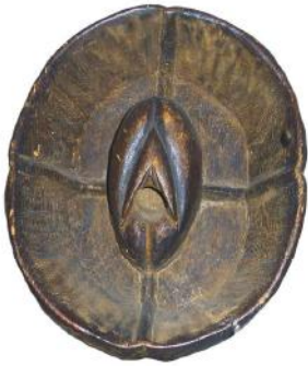
18. Houten schalen met een vulva (boven) en een mannelijk genitaal (onder). (Monpa, India)