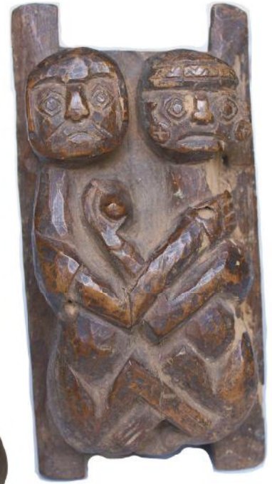
6. Erotische houten sculptuur. (Recuay, Peru)

kinderen een houten pop die duidelijke vrouwelijke kenmerken vertoont, maar waarbij het hoofd dusdanig gesculpteerd wordt dat de globale vorm evident mannelijk is (afb. 4). Hiermede wordt reeds van jongs af aan een soort rollenspel geïntroduceerd als voorbereiding op het echte leven als vrouw of als man.