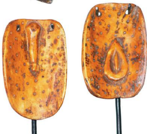
16. Afzonderlijke ivoren rituele objecten met mannelijke en vrouwelijke voorstelling (Lega, DRC)