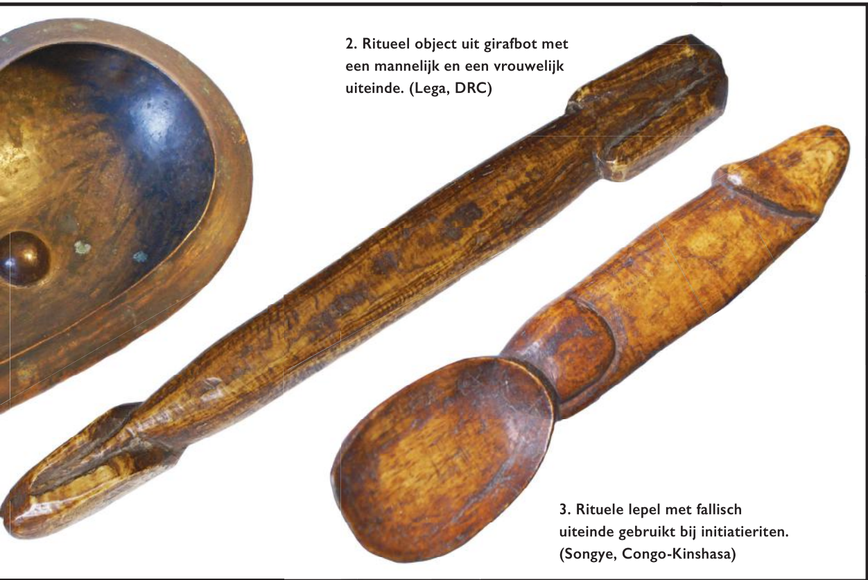
2. Ritueel object uit girafbot met een mannelijk en een vrouwelijk uiteinde. (Lega, DRC)