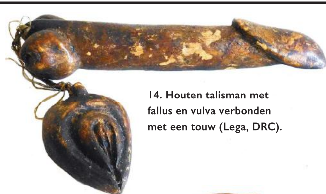
14. Houten talisman met fallus en vulva verbonden met een touw (Lega, DRC).