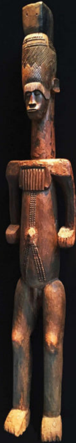
Alusi, gefotografeerd op de BRAFA bij Montagut Gallery uit Barcelona, h 173 cm

zien wat zijn/haar oordeel is. En neen, ik ben het niet altijd eens met hun oordeel, maar ik vermoed toch dat het beter is dan het mijne alleen. Als je standpunt is: ik koop wat ik mooi vind en het kan mij niet schelen of het in een cultus gebruikt is of niet, waarom ga je dan naar een expert? Misschien toch ook een beetje in de hoop dat een goedkoop stuk echt en zeer waardevol blijkt te zijn? Een attest dient ook niet zozeer 'tot meerdere eer en glorie van de eigenaar en tot gewin op een later tijdstip'. Het is een soort garantie dat wat ik gekocht heb ook is wat het moet zijn, namelijk een oud, in een cultus gebruikt stuk. Goedkope valse stukken die duur verkocht worden als echt en authentiek, daar zit het echte gewin. Hoe dan ook, voor mij als verzamelaar van etnografica, is authenticiteit wel degelijk belangrijk. Voor anderen is dat niet zo. Geen probleem, er is plaats voor elkeen, maar verkoop het dan niet als een duur, antiek stuk etnografie!