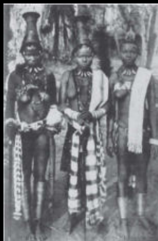
Een trots trio, toekomstige bruiden van chiefs. (foto uit Basden 1921)

Over de meeste volkeren uit Nigeria is lange tijd zeer weinig bekend geweest. Europese bezoekers kwamen meestal niet veel verder dan de handelsposten in de kustzone. De Igbo vormen hierop een uitzondering, omdat ze al vroeg handel dreven met de Europeanen. De contacten waren vrij intens en we weten dan ook veel over hun geschiedenis en gewoontes.