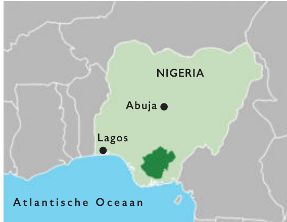
Het leefgebied van de Igbo in Nigeria. (bron Wikipedia, bewerkt door A. Smit)

De Igbo zijn animisten. Ze geloven in een twee-eenheid van de wereld en de bovennatuur, waar de goden en de voorouderlijke geesten wonen. Er is wederzijds contact en beïnvloeding. Na de dood gaat de geest van de overledene naar de voorouders, waar hij bij de goden kan tussenkomen om zijn familie en clan op aarde te helpen. Dit is nodig, omdat de geesten ook een kwade invloed kunnen hebben via waarzeggerij, hekserij en magie. De cultus van de Igbo is daarom sterk gefocust op menselijke activiteiten en op