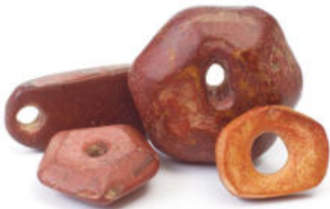
Twee 'binou magarra' kralen van rode jaspis met twee andere kralen, in Mali gevonden.

Priesters vertellen dat deze stenen, in de vorm van kralen, alleen maar gevonden kunnen worden. Op deze manier wordt een persoon actief door de kraal als kedjou priester uitverkoren. Kedjou betekent degene die ontvangt, helpt en begeleidt. De cultus die deze priesters verzorgen heet binou en onderhoudt de harmonie tussen de mens en bovennatuurlijke krachten. Het woord binou wordt ook gebruikt voor een bovennatuurlijke wezen of voorouder die onsterfelijk is. Deze beschermt en wordt in het een orakel geraadpleegd. De gevonden kralen worden binou dugue genoemd.