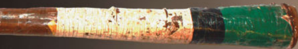
De tape is aangebracht om scheuren af te sluiten. #2 betekent dat er iemand anders is met de zelfde naam.

Alle didgeridoo's privécollectie M. Teijgeler