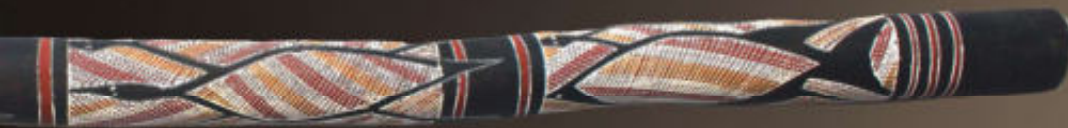
De Mago van Mickey Hall uit de omgeving van Beswick (Zuidwest-Arnhemland), verzameld rond 2000, lengte 130 cm.