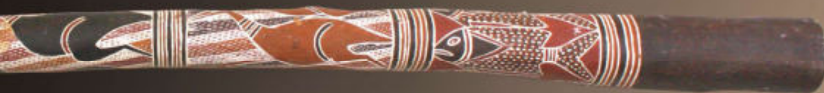
Yidaki van Narritjin Maymurruru van de MangGalilli clan, verzameld in 1968 in Yirrkala, lengte 142 cm.