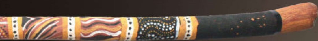
Een Marrluk uit de omgeving van Wadeye (Port Keats) verzameld rond 1990, lengte 132 cm.