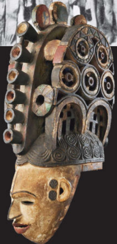
Foto rechts: Maiden spirit masker. Galerie Kathy van der Pas en Steven de Raadt

Foto boven: Een gemaskerde jongerengroep met maskers gemaakt van bladeren, takken, touw, weefsels... Foto N.W. Thomas, 1913