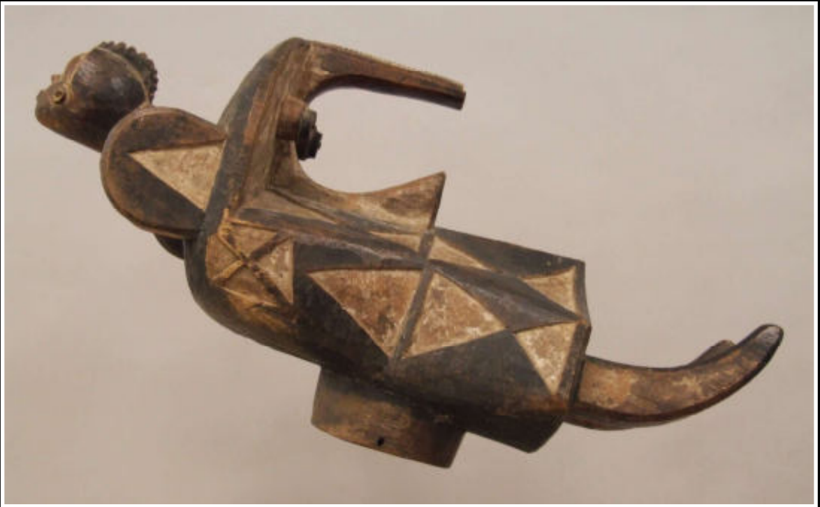
Boven: Ogbodo Enyi, een gestileerde olifantenkop met een menselijk hoofd, 30 x 24 x 62 cm.