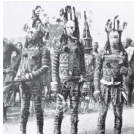
Boven: Okperegede kan meerdere hoofden hebben. Daarmee toont hij dat hij alles ziet, dat niets voor hem verborgen blijft, eerste helft 20ste eeuw, 46 x 41 x 11 cm.