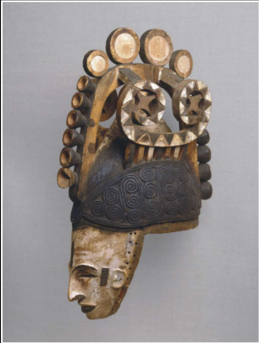
Maiden spirit masker, 20e eeuw, 50 x 14 x 13 cm. Aan de schoonheid van het gelaat en de kapsels wordt veel aandacht bested.