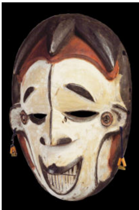
Het okoroshi masker kent een vriendelijke en een agressieve versie, 20ste eeuw, 23 x 16 x 6 cm.

Er bestaan verschillende maskers voor elke leeftijdsgroep. De jongeren hebben er vijf of zes, maar er is er maar een voor de oudste groep en dat masker is eigendom van de clan. De jongerenmaskers dienen om geleidelijk op te groeien in de gebruiken van de cultus en uiteindelijk 'rijp' genoeg te zijn om het oudenmasker te mogen dragen. Het is een vorm van sociale opvoeding. Het masker is zeer gestileerd en wordt horizontaal op het hoofd gedragen.