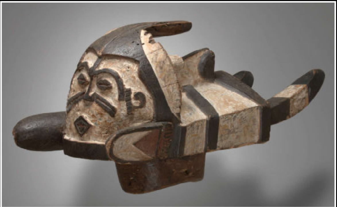
Onder: Achterkant van een Ogbodo Enyi masker, vroeg 20ste eeuw, 30 x 20 x 58 cm.