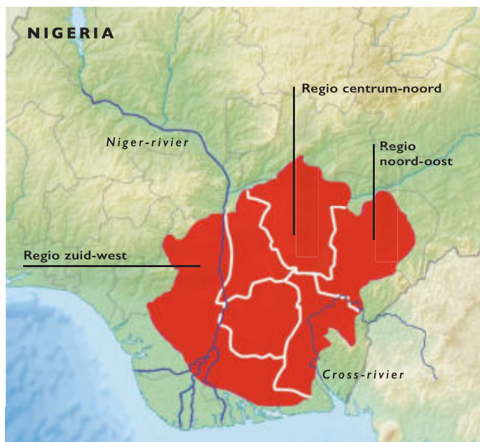
Zuidelijk deel van Nigeria met Igboland.

Etno-linguistische kaart, bewerking André Smit.