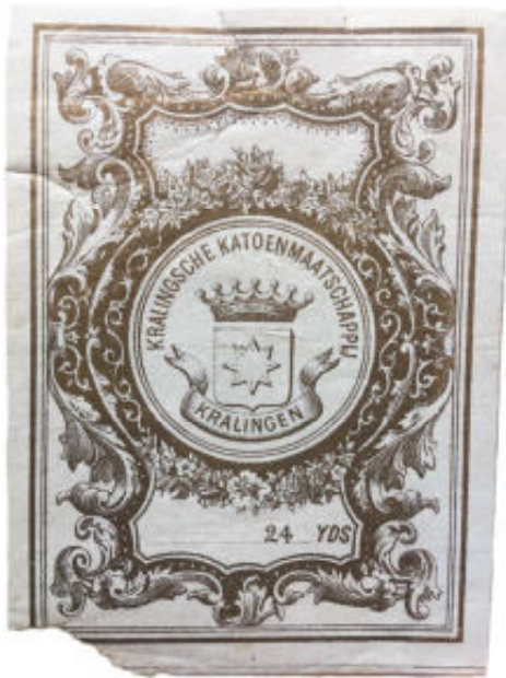
Etiket van de Kralingsche Katoenmaatschappij.