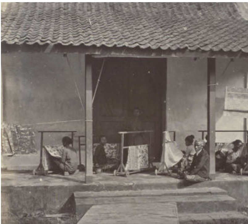
Een groepje batikkende vrouwen op de veranda voor een huis in Semarang, gefotografeerd tussen 1863 en 1869.

getekende' batiks, werden al voornamelijk gemaakt op geïmporteerd katoen uit India. Deze fijner geweven doeken waren geschikter om hierop met een waspen de patronen aan te brengen. De doeken die halverwege de 19e eeuw met (semi-) mechanische weefgetouwen geproduceerd worden, zijn nog fijner, nog dichter geweven en maken het mogelijk dat aan het eind van de 19e eeuw de hoogste kwaliteit batiks gemaakt worden. De imitaties zorgen er dus eigenlijk voor dat er meer waardering komt voor de lokaal gemaakte stoffen en zorgt voor een industrie waarin zowel mannen als vrouwen aan de slag kunnen. De wereld van Batik Tulis is namelijk echt een vrouwenwereld. Traditioneel wordt de batiktechniek doorgegeven van moeder op dochter. De dochters gaan op jonge leeftijd in de leer. Hierbij leren ze niet alleen de techniek, maar ook de betekenis achter motieven en rituelen die bij het maken horen. Bij sommige motieven moet de batikmaker voorafgaand mediteren en er zijn verschillende leeftijdregels verbonden aan het maken van verfbaden. Met de opkomst van de cap komt daar verandering in. Het stempelen met de koperen cap is zwaarder werk dat door mannen gedaan wordt. Tevens wordt het uitkoken van de was vaker door mannen overgenomen. Het huis-ambacht verplaatst naar een grotere onderneming, de batikkerij