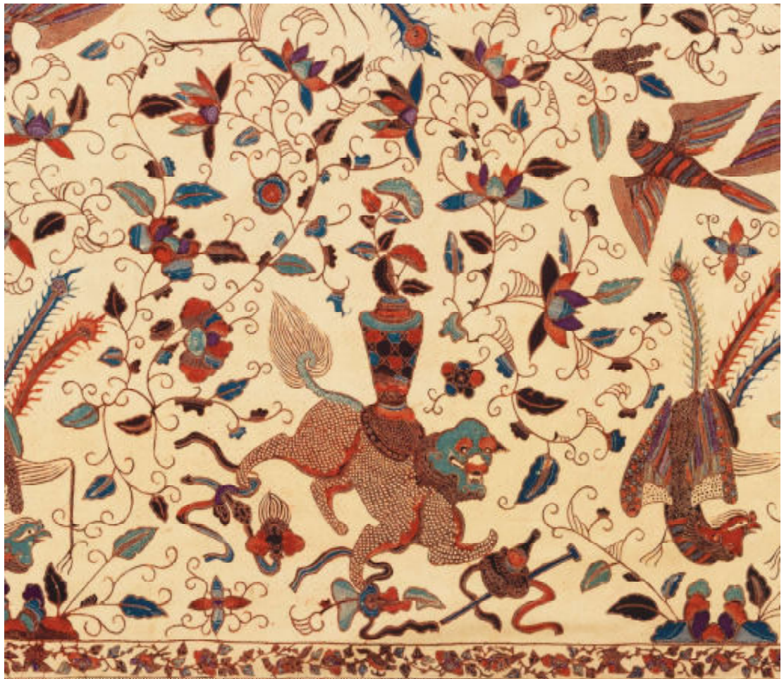
Boven: Imitatie batik gemaakt door de Kralingsche Katoenmaatschappij. Coll. Museum Rotterdam, invent.nr. 23006 Onder: Detail van Batik Tulis van pagina 47. Coll. NMvW, invent.nr. WM-26918