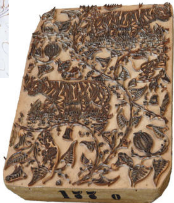
Foto geheel boven: Batik Tulis geschonken door G.P. Rouffaer in 1928. Coll. NWvW, invent.nr. WM-26918 Foto boven: Het aanbrengen van de was met een canting (waspen). Foto Sabine Bolk (2016) Rechts: Logo van de Nederlandsche Handel-maatschappij Bron NHM Rechtsonder: Drukblok van de Kralingsche Katoenmaatschappij. Coll. Museum Rotterdam, invent.nr. 91393