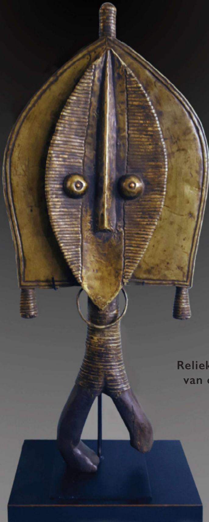
Reliekwacher van de Kota