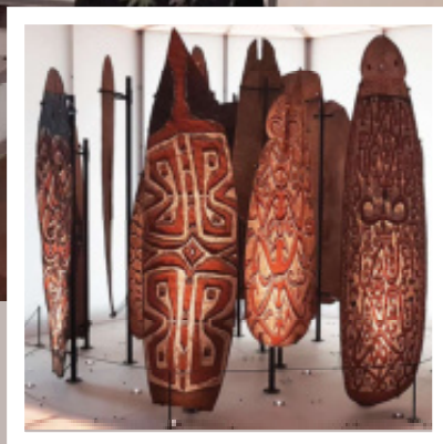
Onder: Topstukken Asmat-schilden uit zuidwest Nieuw-Guinea.