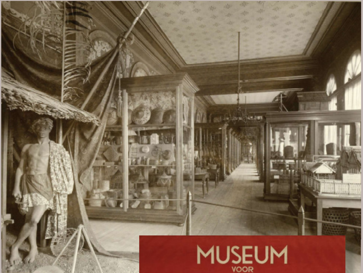
Boven: De nieuwe opstelling, 1908. Gemeentearchief Rotterdam Rechts: Het affiche van het museum tussen 1930 en 1940. Gemeentearchief Rotterdam