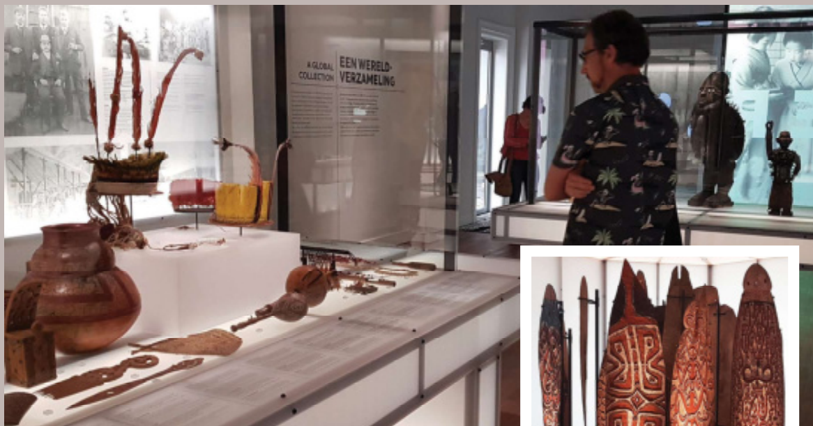
Boven: Deel van de collectie verzameld tijdens de Tapanahoni expeditie (Suriname) in 1904. Bron Wereldmuseum