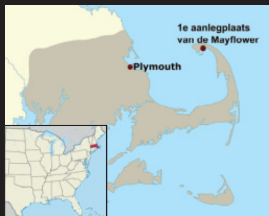
Kaart N-Amerika met plaats van aankomst en vestiging. Bron wikimedia bewerkt door A.Smit