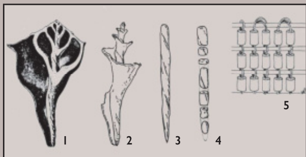
Het maken van de witte wampum-kralen: 1. Het hele slakkenhuis. 2. De ruw uitgehakt centrale cylinder van de schelp. 3. De fijn geslepen centrale schacht. 4. Door de schacht in delen te snijden ontstaan de kralen. 5. De kralen worden tot wampum geweven.