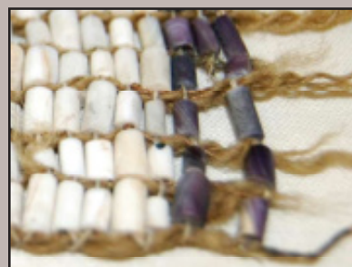
Detail van de op pagina 31 afgebeelde wampum met bastvezels.