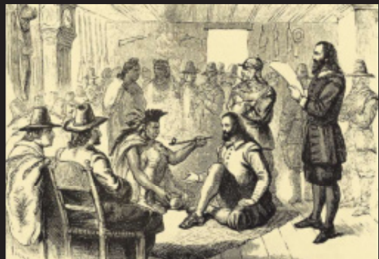
Opperhoofd van de Wampanoag rookt vredespijp met pilgrimfather John Carver.