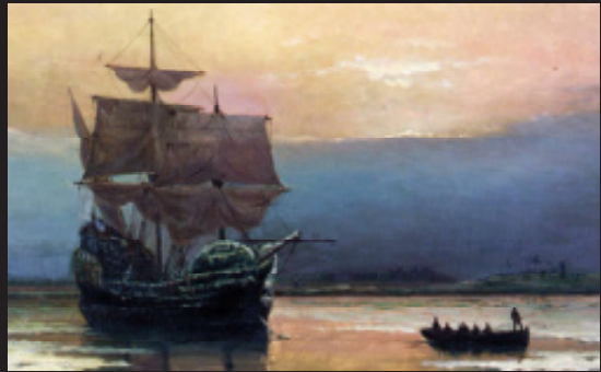
De Mayflower . Bron Wikipedia

De tentoonstelling First Americans – eerbetoon aan inheemse kracht en creativiteit in Museum Volkenkunde Leiden is nog het hele jaar te zien. tkcredactie@gmail.com