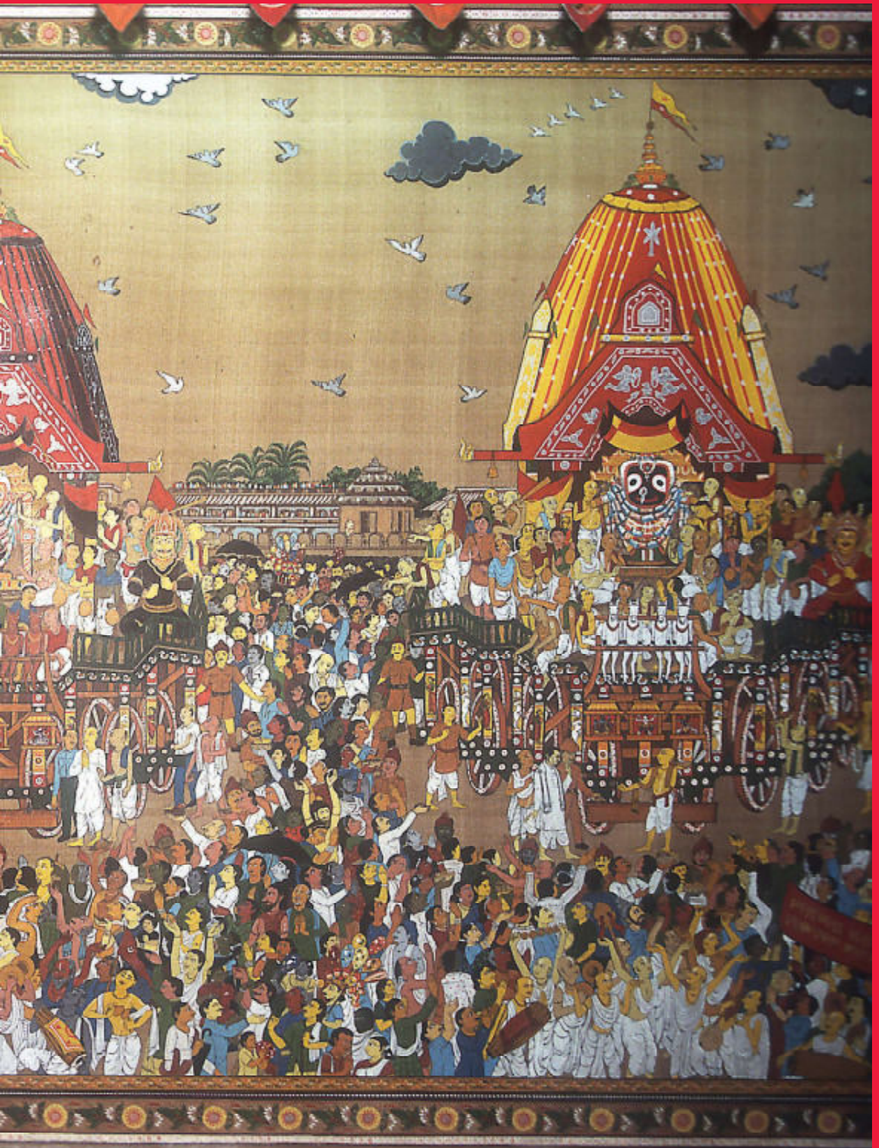
festival uit vervlogen jaren.