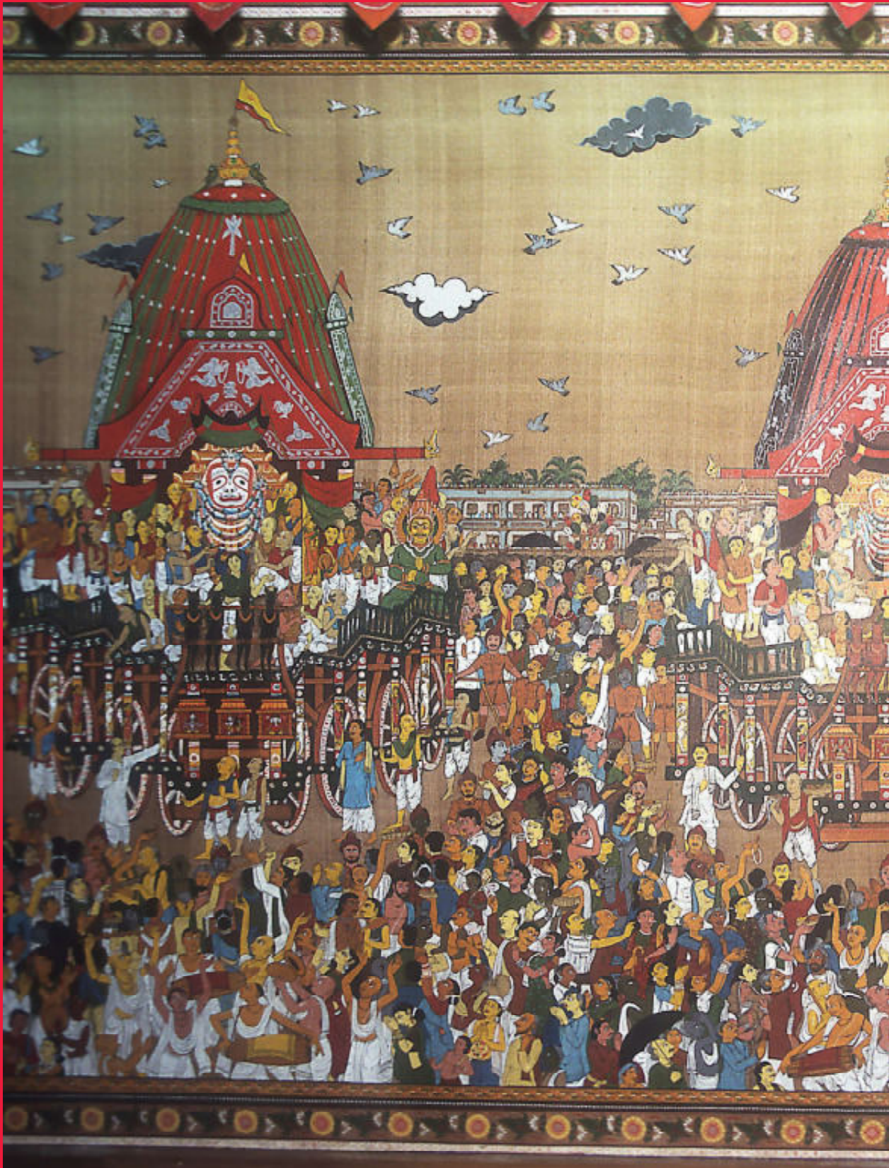
In het museum van Puri hangt een afbeelding van de met pracht en praal omgeven viering van het Rath Yatra