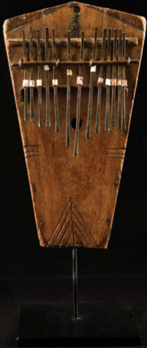
Sanza, Tanzania. Houten klankkast, lamellen van ijzer. Collectie auteur