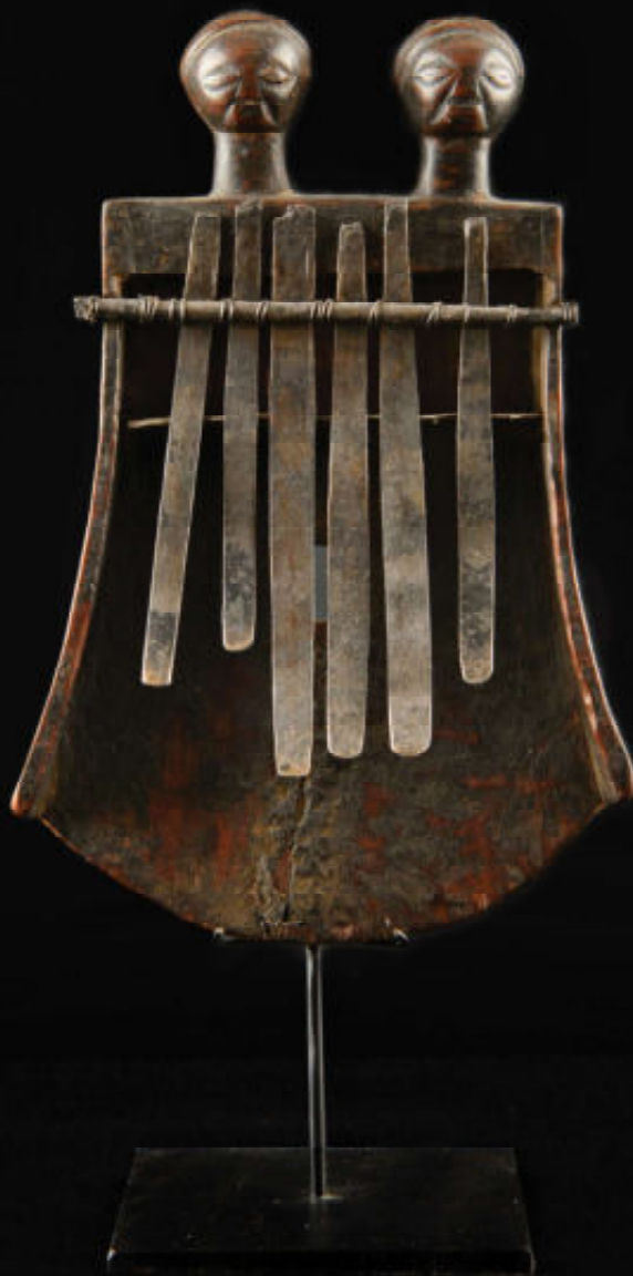
Sanza Luba D.R. Congo (Collectie auteur, foto Christine van Doorn)