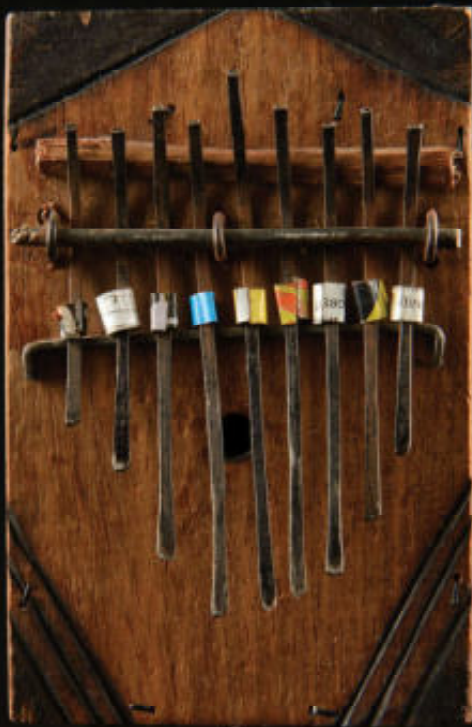
Kleine sanza voor kinderen. Tanzania Collectie auteur