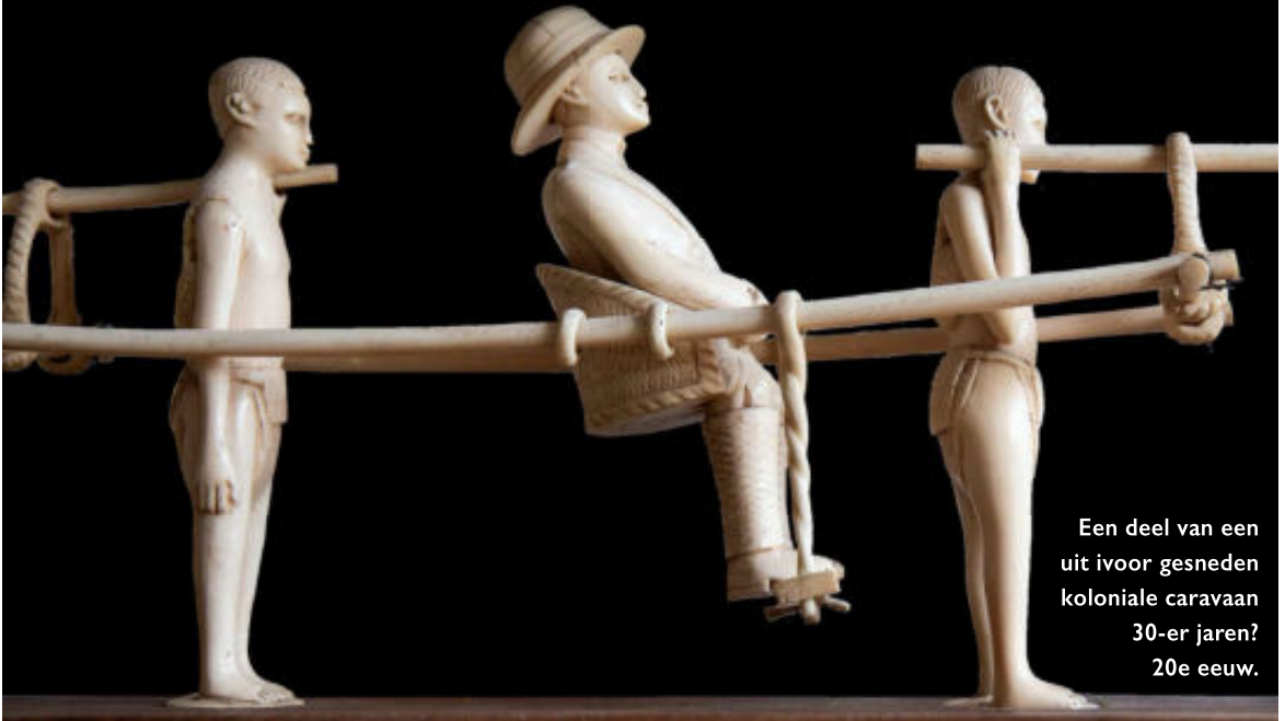
Een deel van een uit ivoor gesneden koloniale caravaan 30-er jaren? 20e eeuw.

Nu al weer zo'n kleine 20 jaar geleden heeft Folke zich letterlijk gestort op de etnografica. Gestort kan met een gerust hart gezegd worden, want het enthousiasme waarmee Folke zijn hobby beoefent, straalt ervan af. Het is vooral de invloed die de westerse mens heeft op mensen met een totaal andere sociaal culturele achtergrond, die hem boeit. Met name de invloed op de Afrikaanse samenleving.