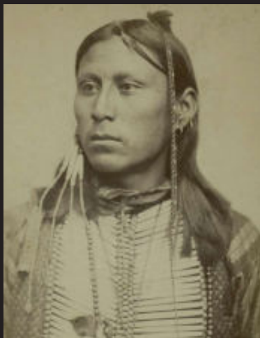
Kiowa-indiaan uit Oklahoma, Verenigde Staten, ca. 1880.