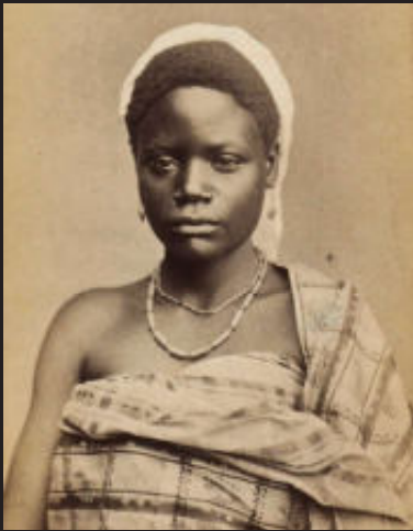
Vrouw, Cabinda, Angola, ca. 1880.