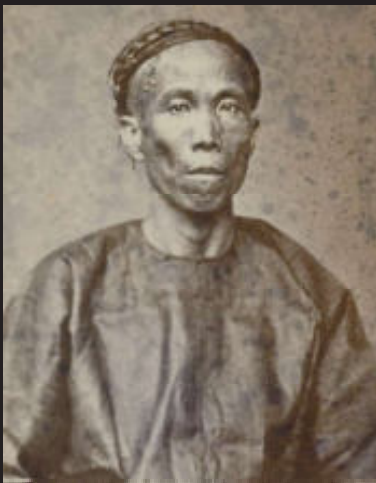
Chinees, Reunion, overzees Frans departement, ca. 1870