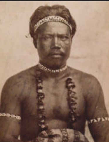
Man, Samoa, Polynesië, voor 1880.