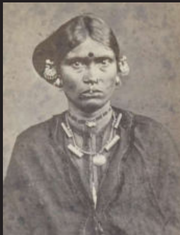
Vrouw, Madras, India, 1870