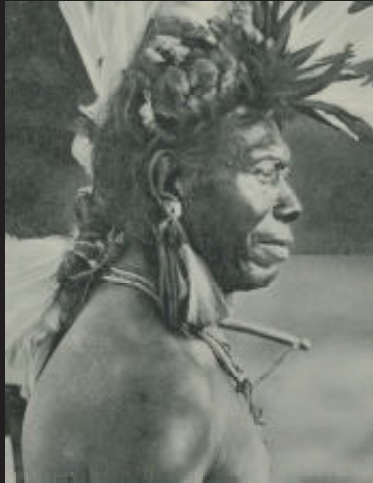
Chamacoco-indiaan, Chaco-regio, Paraguay, ca. 1900