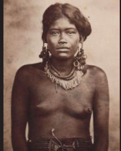
Meisje met sieraden, Caroline-eilanden, Micronesië, 1880