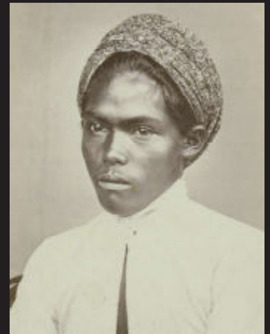
Man met hoofddoek, Java, Indonesië, 1875