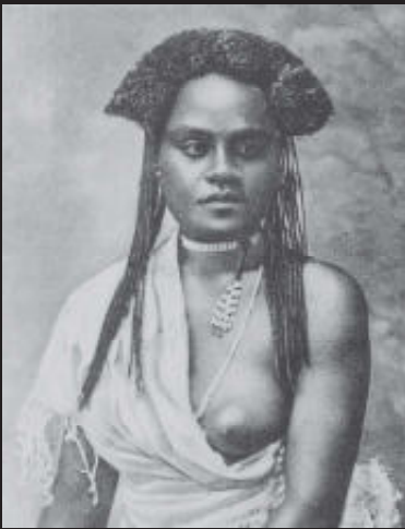
Vrouw, Fiji, Melanesië, voor 1920

Elke dag worden er meer dan 2,5 miljard foto's gemaakt. Bovendien wordt een groot aantal van die foto's kwistig over de wereld uitgestrooid en dan vooral met als doel te vermaken. Dat lag aan het eind van de negentiende eeuw wel iets anders. Alleen gedreven foto-pioniers beheersten het werk met de primitieve camera's en legden de wereld rondom hen vast. Antropologen, geschiedkundigen en sociologen maakten graag gebruik van de 'nieuwe techniek' om leden van exotische, vreemde en soms onbekende bevolkingsgroepen vast te leggen. Deze meer dan honderd jaar oude 'pasfoto's' (nu een fascinerende portretten-galerij) zouden decennia lang als studiemateriaal voor de wetenschap dienen.