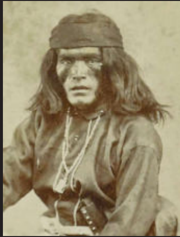
Apache-indiaan, Arizona, Verenigde Staten, 1903