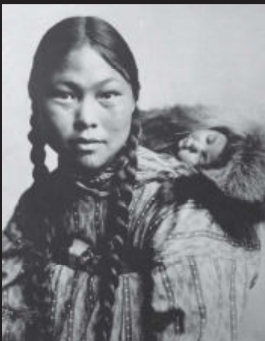
Inuit-vrouw met kind, Alaska, rond 1906.