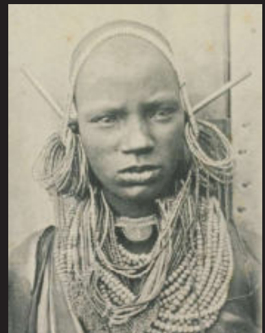
Kikuyu-vrouw, Mombassa, Kenia, voor 1920