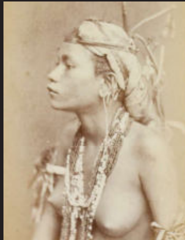
Vrouw met sieraden, Molukken, Indonesië, 1865