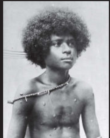
Papoea-jongen, Manokwari-gebied, Nieuw-Guinea, 1907.