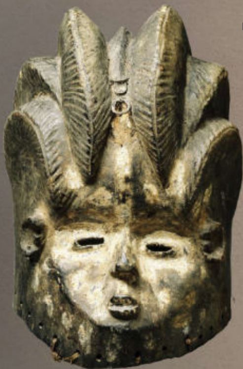
Links: Gonde-maskers worden vaak voorzien van een witte beschildering.