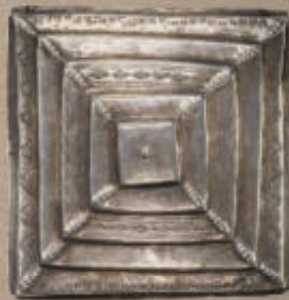
Rechts: Zilveren hanger met Korantekst.