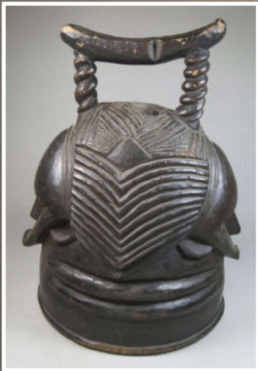
Links: Janus helm- masker