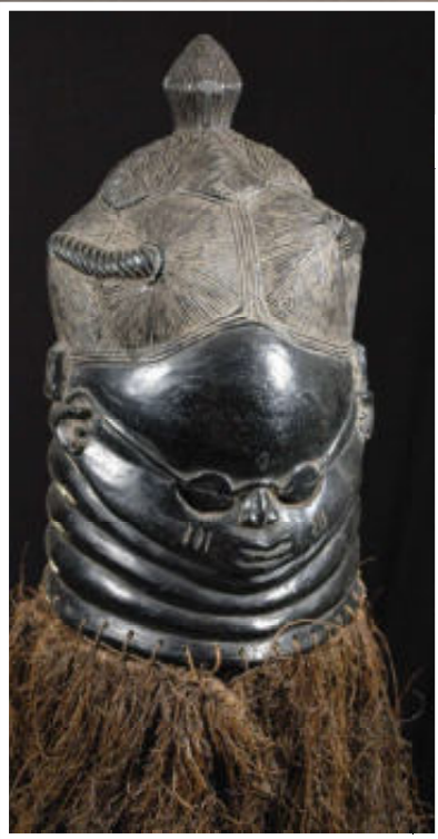
Links: Helmmasker met bril.