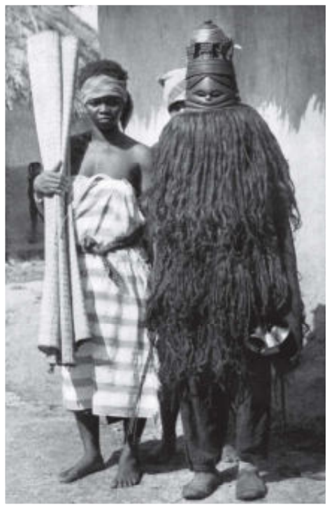
Links: Danser met haar begeleider, digba.