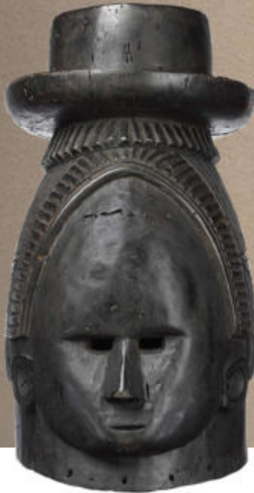
Rechts: Helmmasker met kroon en paraplu.