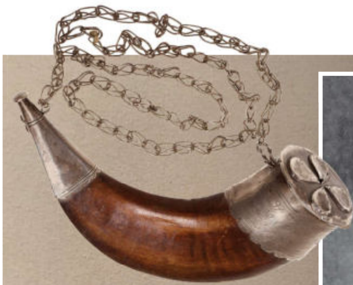
Boven: Hoorn met Korantekst of medicijnen.