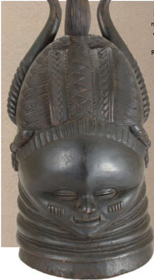
Links: Helmasker met terneergeslagen ogen