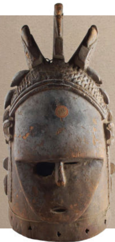
Rechts: Beschadigd helmmasker dat als Gonde-masker gebruikt wordt.

worden vaak begeleid door een andere masker, die van de Gonde. Het gonde-masker is een clowneske figuur die in gedrag en voorkomen totaal tegengesteld is aan het plechtige van het soweï wui-masker.