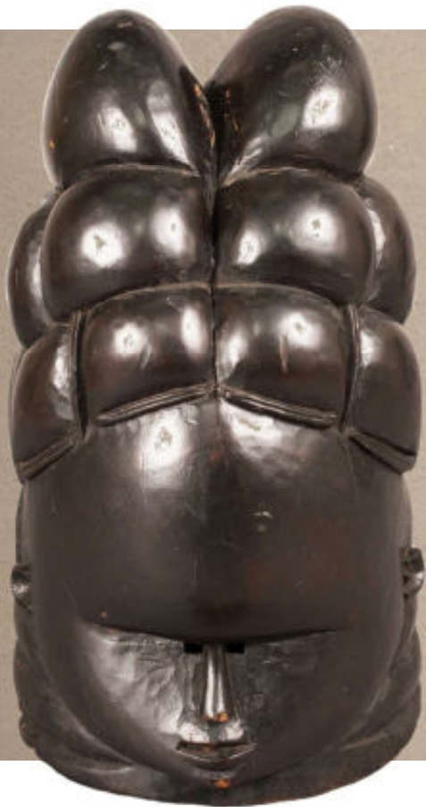
Rechts: Helmmasker van de Gola met lobbenkapsel