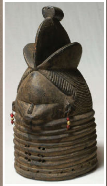
Rechts: Helmasker met kijkgaten in de halsplooiën

gezien als een schoonheids-ideaal en een teken van vruchtbaarheid, vitaliteit en gezondheid. Deze karakteristieke ringen aan de basis van de maskers kunnen ook worden verklaard als de concentrische rimpelingen van de geest uit het water. Een andere verklaring is dat ze symbool staan voor de verwevenheid van de Mende met de wereld van de geesten. De ogen zijn vaak neergeslagen of bijna gesloten en vormen de gleuven waardoor door het masker gekeken kan worden. Ook komen spleten in de ringen van de nek voor om doorheen te kijken. De mond is klein, gesloten of zeer licht open, omdat discretie en zwijgzaamheid idealen