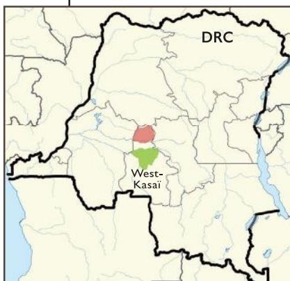
Boven: De Ndengese (rose) en de Kuba (groen) leven in het noorden van de provincie West-Kasaï in de DRC.