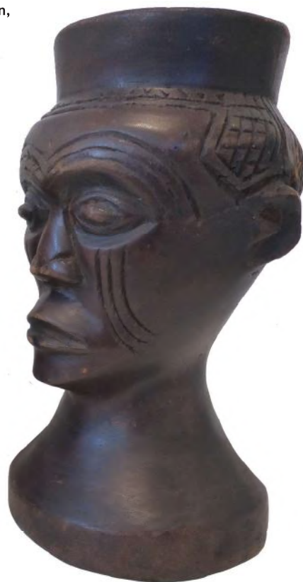
Rechts: Op deze palmwijnbeker van de Kuba wordt de typische insnijding van het kapsel weergegeven.