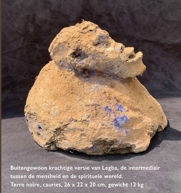
Buitengewoon krachtige versie van Legba, de intermediair tussen de mensheid en de spirituele wereld.

Terre noire, cauries, 26 x 22 x 20 cm, gewicht 12 kg