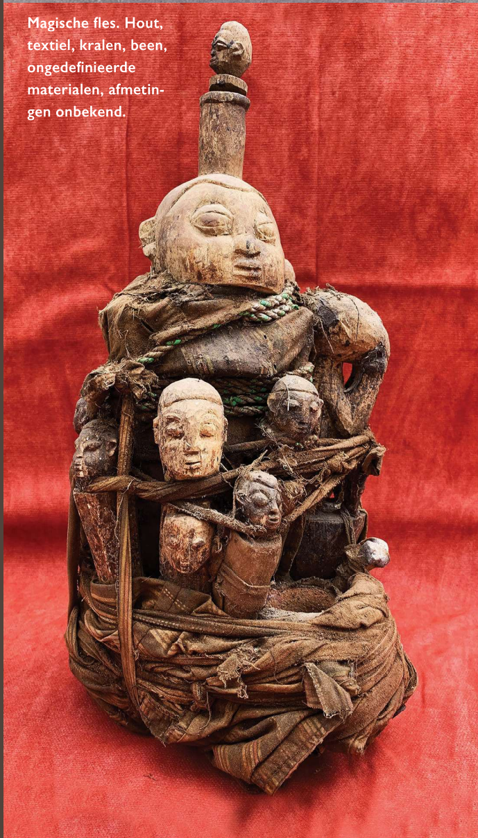
Magische fles. Hout, textiel, kralen, been, ongedefinieerde materialen, afmetingen onbekend.

Terre noire, cauries, 26 x 22 x 20 cm, gewicht 12 kg