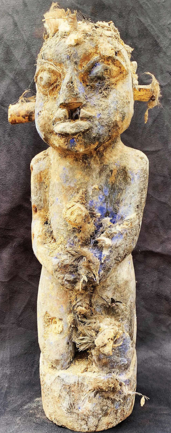
Krachtbeeld. Hout, veren, blauwsel, ongedefinieerde materialen, 38 x 16 x 15 cm, gewicht 4,2 kg

De eerste foto, aan het begin van dit artikel, is een opstelling die gekopieerd is naar het voorbeeld van een asen -heiligdom in situ. De asen zijn