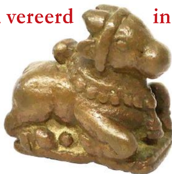
Rustende Nandi van brons, 8 x 4,5 cm.

Het festival heet Pola, omdat de demon Polasur door Heer Krishna werd gedood toen hij Krishna als kind aanviel. Dit is een van de redenen waarom