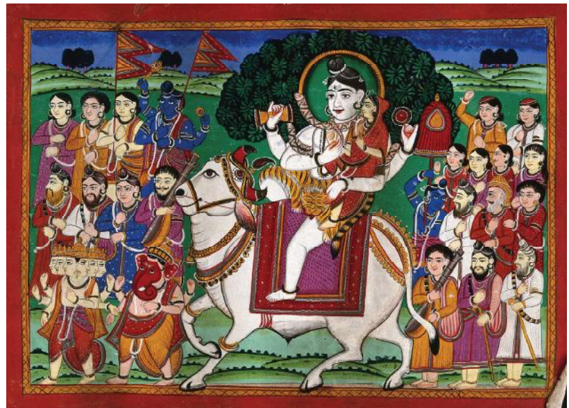
De god Shiva en zijn vrouw Parvati gezeten op de stier Nandi tijdens een processie.

Pagina 58 grote foto: Een gigantische Nandi-stier bij de ingang van de Brihadisvara-tempel bij het stadje Gangaikonda Chola-puram in de deelstaat Tamil Nadu. Deze uit steen gehakte stier is 6 meter lang, 2 meter hoog en 2,5 meter breed (gewicht 25 ton) en is daarmee de grootste in India. Kleine afbeelding: Schilderij op papier van de witte Nandi. Hij draagt een kroon en in zijn rechteronderhand draagt hij een lange staf met daarop een gehurkt Nandi-beeld.