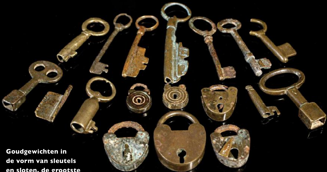
Goudgewichten in de vorm van sleutels en sloten, de grootste sleutel is 9 cm.