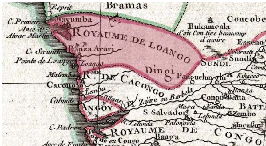
Oude kaart van het koninkrijk van Luango. detail van een kaart van Rigobert Bonne uit 1770.