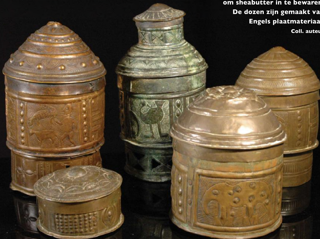
Bronzen of messing Forowa-dozen om sheabutter in te bewaren. De dozen zijn gemaakt van Engels plaatmateriaal.