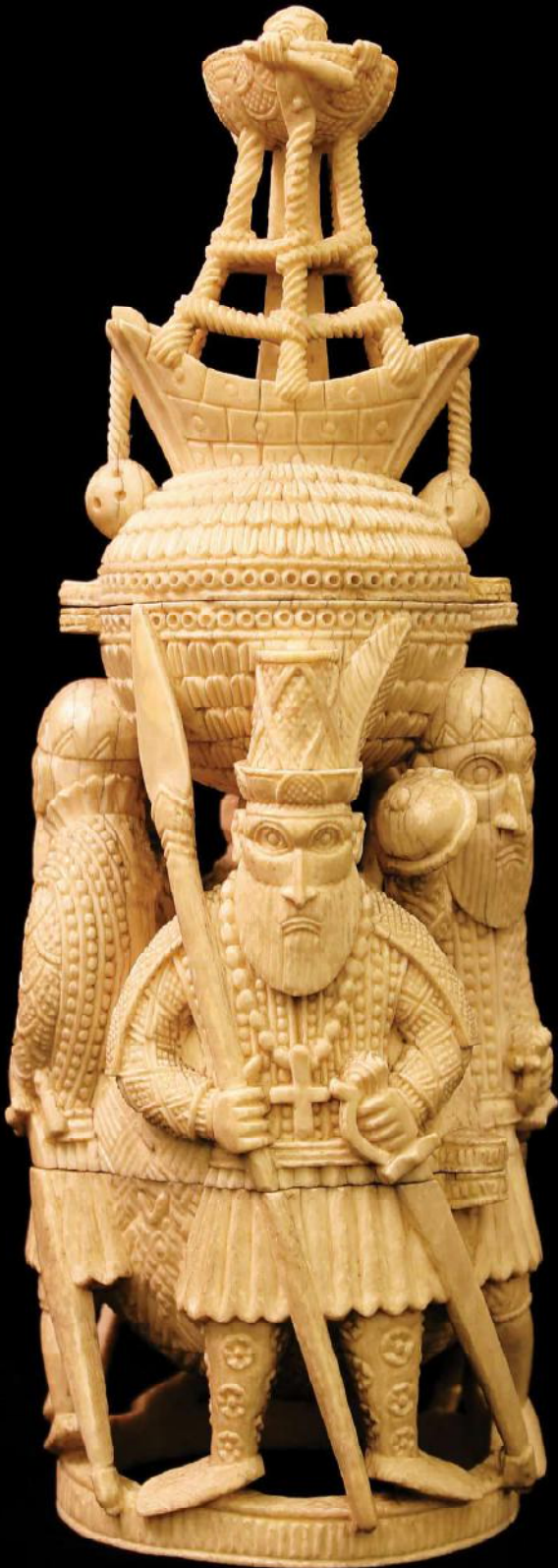
Ivoren zoutvat, gesneden voor de Portugese of Europese hofhouding, h 29,5 cm.