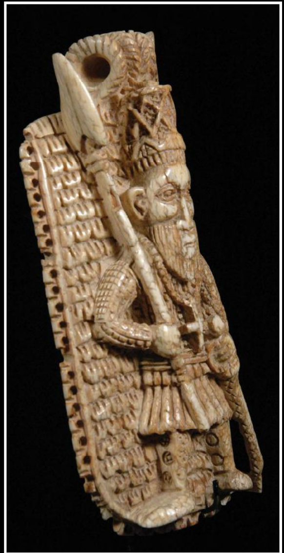
Hanger of amulet met een Portugese soldaat met baard en een groot kruis, ivoor, h 19 cm.