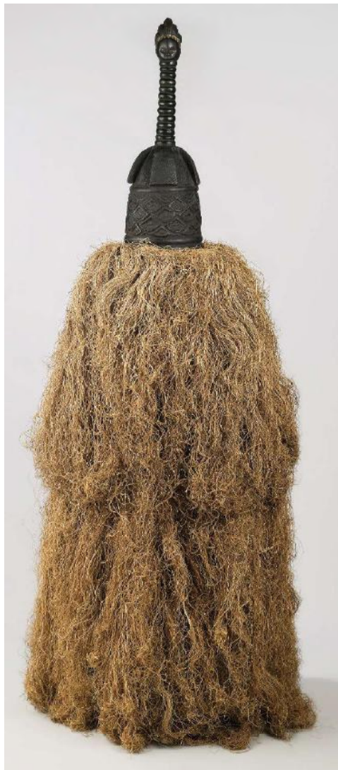
Danser met helmmasker (Gbetu) en raffia kostuum. De figuur stelt eveneens het primordiale koppel voor. Wikipedia

De initiandi dragen dan een ceremoniële hoofdtooi, die kwonro of kworo wordt genoemd. Het zijn opzetmaskers die bestaan uit een gevlochten mandje om op het hoofd te zetten en een plankvormig deel met een uitgesneden motief dat een mens, een geest of een reptiel zou voorstellen. Ze zijn tot 80 cm hoog. Daarnaast zijn er nog de grote maskers, die eveneens kwonro of kworo heten, met een houten opzetbasis en een sterk uitgewerkt bovenstuk van soms wel 150 cm hoog. Meestal zijn er figuren van mensen aan vastgemaakt met een soort krammen, zowel aan de voor- als aan de achterzijde. Op de bovenrand zitten