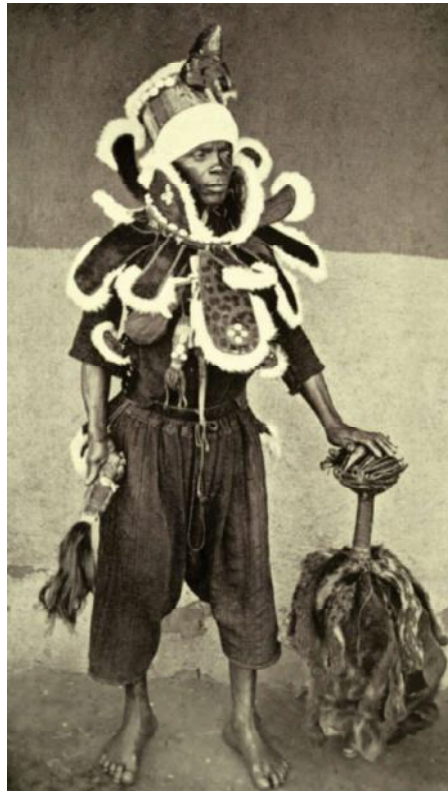
Gemaskerde poro-danser. Uit Human leopards van K.J. Beatty (1915)

troffen. Men vermoedt dat de plaats fungeerde als een soort opslagplaats voor beelden uit dorpen waar de Massa-beweging zijn intrede had gedaan, om ze te redden van de vernieling. Een deel van de beelden wordt toegeschreven aan de snijders van San, een klein, meer zuidelijk gelegen dorp waar meerdere generaties beeldhouwers woonden. Typisch zijn de wat eigenaardig gebogen voorarmen en de speciale vorm van de handen, evenals de uitgerekte gelaatsvorm