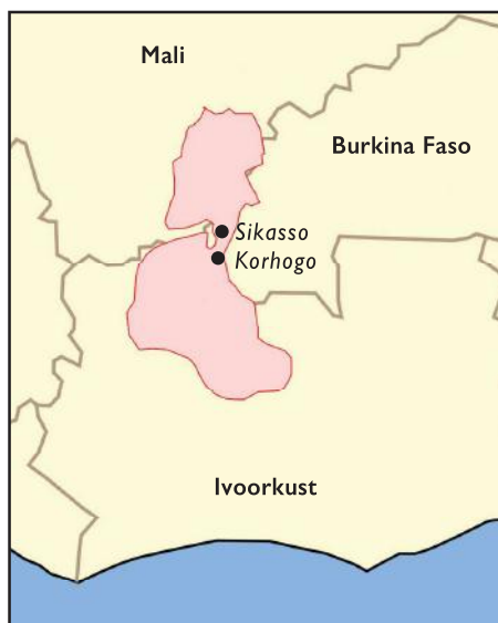
Het woongebied van de Senufo in het grensgebied van Ivoorkust, Mali en Burkina Faso.

Tijdens hun opleiding worden aan de jongens alle geheimen van hun gemeenschap en van hun cultuur onderwezen. Daarbij wordt gebruik gemaakt van een uitgebreide symbolische taal - te denken aan het gebruik van spreekwoorden om situaties te duiden, de betekenis van kleuren, van totemdieren en van rituelen.