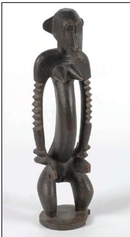
Tugubèlè beeld, h 34 cm.,

Maskers komen tussen om de overgang van initiandi naar volwaardig lidmaatschap van de poro te begeleiden. Zolang