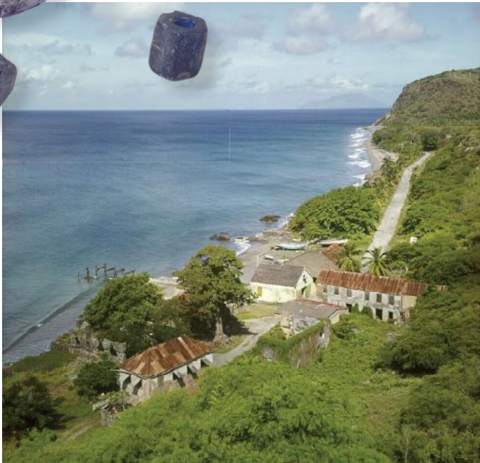
Gezicht vanaf Fort Oranje op de resten van pakhuisen en de oude pier.