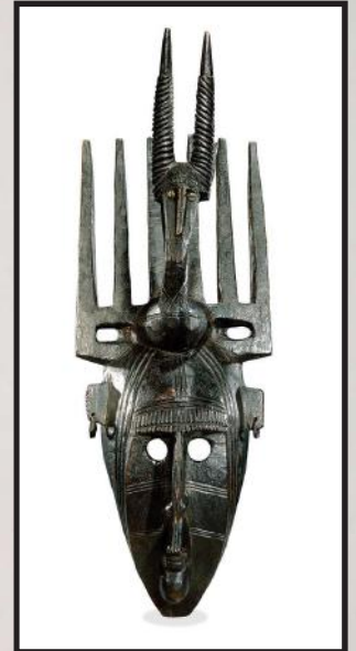
Een Bamana-masker uit het begin van de 20ste eeuw. (h. 56 cm)

Een masker met vijf horens en geen mond, versierd met kaurischelpen. Het masker verbeeldt een onbesneden jongen, een 'androgyn en onmondig mens'.