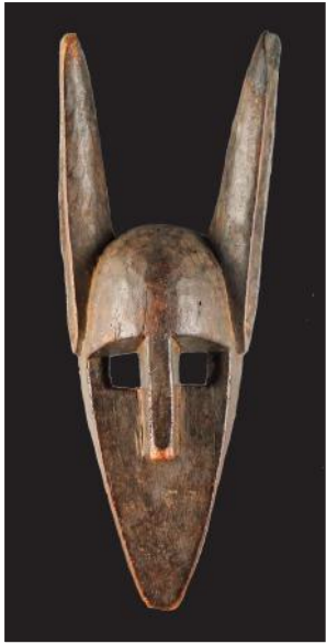
Houten Bamana-masker met twee oren, afkomstig uit Mali. (h. 47cm)