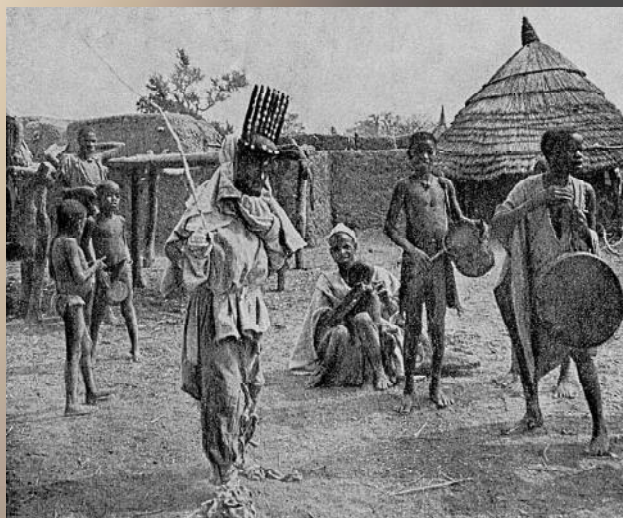
Boven Kaart met in rood het leefgebied van de Bambara. Onder: Een N'tomo-masker met zeven hoorn, een androgyn (niet volwassen) masker, tijdens een initiatie-feest.

van de verandering van de jongens. Ze zijn nu geen kind meer maar man en weten hoe ze moeten omgaan met vrouwen en wat van hen verwacht wordt in de maatschappij. Tevens moeten de jongens hun moed bewijzen en tonen dat ze zonder verpinken pijn kunnen verdragen. Ze slaan zich daarbij met een zweepje op het lichaam. Ook moeten ze zweren dat ze de geheimen van het genootschap zullen bewaren.