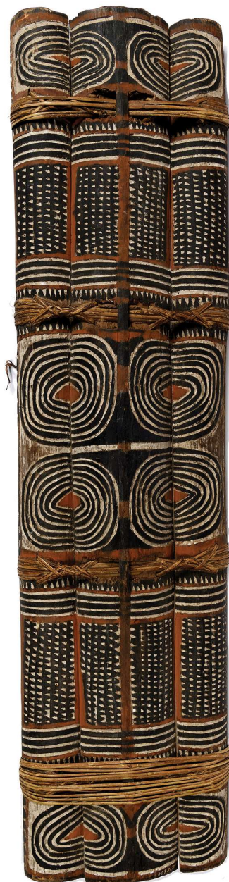
Een Arawe-schild waar behalve spiralen ook driehoekjes als motief zijn aangebracht, ca. 1914, h. 132 x b. 35 x d. 8 cm. Bron NMvW coll.nr. TM-2309-20