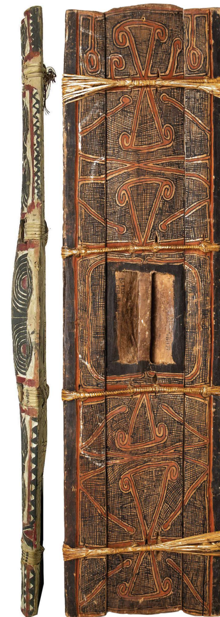
Een Arawe-schild in zij- en achteraanzicht. De afbeelding van het zijaanzicht laat duidelijk de verdikte middenplank zien, daar waar zich aan de achterzijde het verzonken handvat bevindt. Op de achterkant de persoonlijke c.q. clan-kenmerken. Begin 20ste eeuw, h. 148 x b. 40 x d. 9 cm.

Bron inzetkaartje: Papua New Guinea free map, free blank map, free outline map, free base map outline, provinces (d-maps.com), hoofdkaart: Wikimedia. Bewerking André Smit