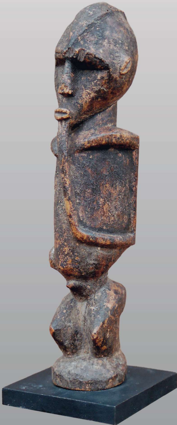
Bateba yadawora, de treurige bateba (h. 17 cm). Met zijn hand aan de kin lijkt hij in gedachten verzonken. Hij heeft een probleem en wil dat de thil het van hem over neemt.

2. De tweede groep zijn de droevige bateba ( bateba yadawara ): ze houden één of beide handen aan de kin, de mond, het hoofd of op de rug en drukken verdriet uit. Ze dienen om tegenslagen van de mens over te nemen.