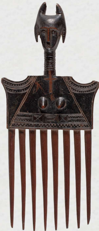
Asante, Ghana, 1900-1940 Hout, h. 25cm, Coll.: Indianapolis Museum of Art