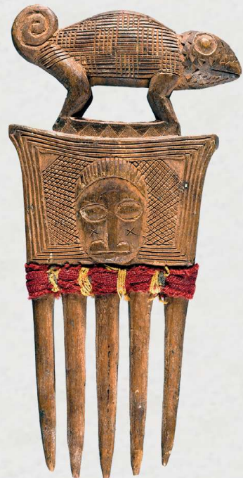
Baule, Ivoorkust, 1920-1960 Hout en stof, h. 11cm, Coll.: Indianapolis Museum of Art