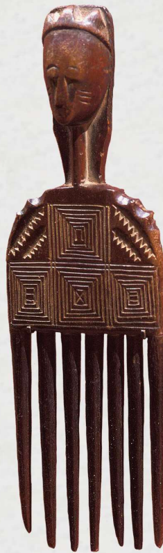
Fante, Ghana, ± 1930 Hout, h. 30 cm, Coll.: Indianapolis Museum of Art