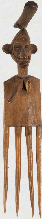
Yaka, DR Congo ± 1900 Hout, h. 19cm, Coll.: NMVW