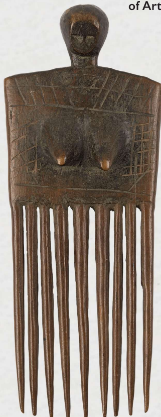
Luba, DR Congo ± 1900 Hout en metaaldraad, h. 30cm, Coll.: Cleveland Museum of Art