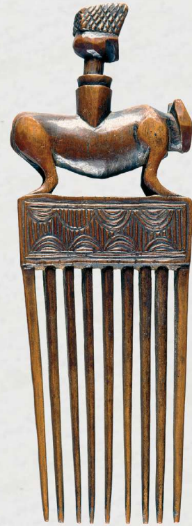
Songe, Angola, 1890-1930 Hout en marmer, h. 20 cm