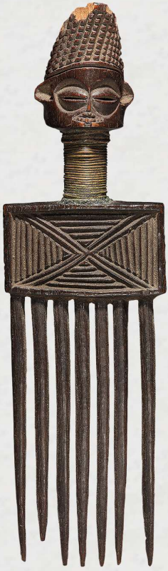
Luba, DR Congo ± 1900 Hout en draad, h. 30cm, Coll.: Cleveland Museum of Art