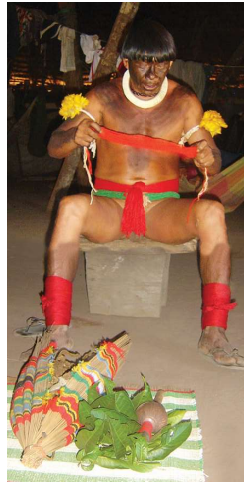
De sjamaan in outfit van de genezer treft voorbereidingen voor de sessie. Voor hem liggen de rammelaar en tabaksbladeren.

Sjamanen worden opgeleid in het vak, nadat zij soms als kind werden herkend op basis van hun dromen, aanleg of vaardigheden. Zij gaan dan in de leer bij een gevestigde autoriteit en verdwijnen vaak lange tijd uit beeld, dan gaan zij in traditionele opsluiting of seclusie. Er zijn gradaties in de kunde en de faam van sjamanen. Relevant zijn de sjamanen die genezing brengen op basis van hun kennis van heilzame planten en kruiden, maar deze kennis is vaak algemener verspreid. Erg gewaardeerd is het sjamanisme op basis van kennis van de geestenwereld. Zulke sjamaan communiceert met de geesten, kan bijvoorbeeld ook heksen identificeren en verloren voorwerpen lokaliseren. Een sjamaan blaast leven in voorwerpen die aldus letterlijk met een geest geanimeerd worden, zoals