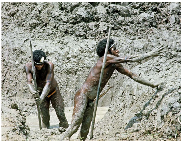
Dani papoea's, Indonesië, 1975