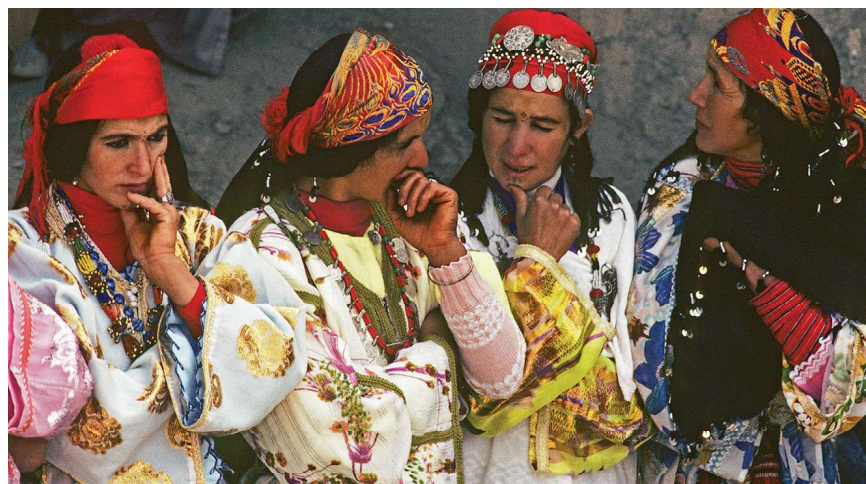
Taddert, Marokko, 1979