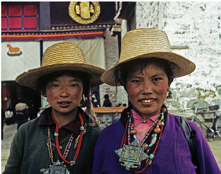
Jukhang tempel Lhasa, Tibet, 1985