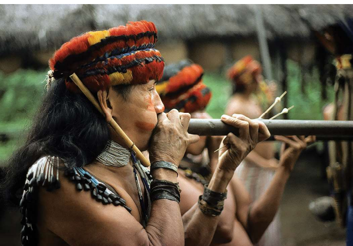
Jivaro indiaan met blaaspijp, Peru, 1980