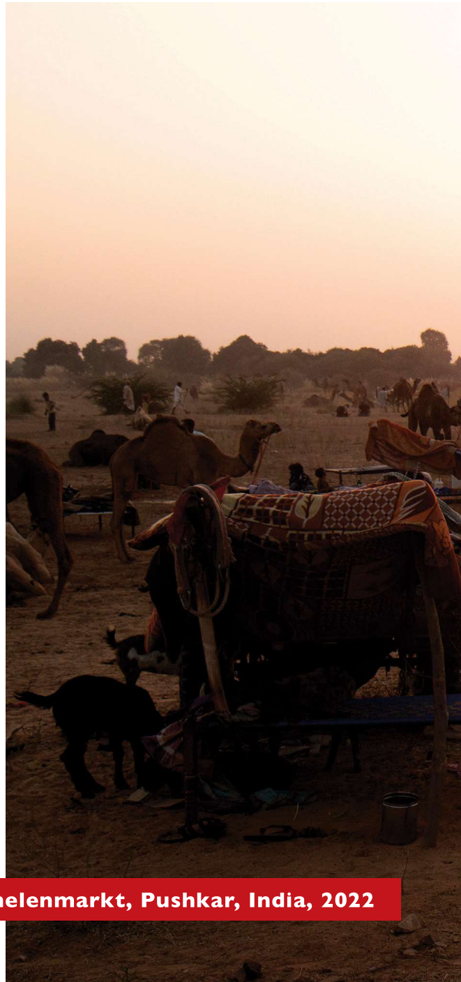
Kamelenmarkt, Pushkar, India, 2022