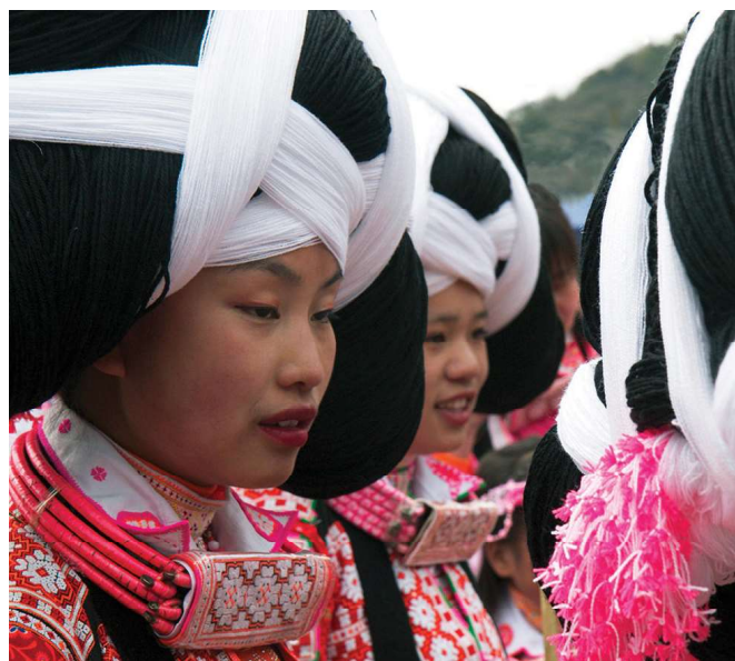
Longhorn Miao, China, 2018