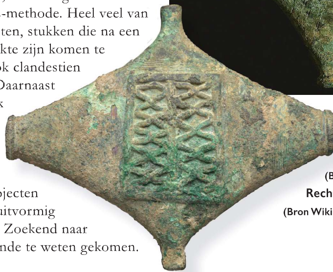
Twee pendanten. Links: 14e-18e eeuw, 9,5 x 7,6 cm