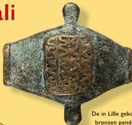
De in Lille gekochte bronzen pendant, 6,4 x 6,1 cm. Coll. auteur

In 2019 kocht ik op de brocante-markt in Lille een 'bronzen' object, waarvan gezegd werd dat het een Djenne* pendant is. Maar hoe werd dit voorwerp gebruikt, door wie en welke betekenis hebben de versieringen?