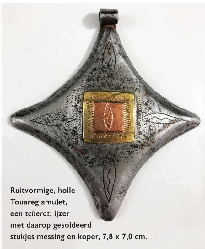
Ruitvormige, holle Touareg amulet, een tcherot, ijzer met daarop gesoldeerd stukjes messing en koper, 7,8 x 7,0 cm.

gen. Zeker is dat het bezit van objecten van messing, met name die uit de 7e tot 17e eeuw, verbonden waren met een hoge status en daarom werden meegegeven in het graf van chiefs en notabelen.