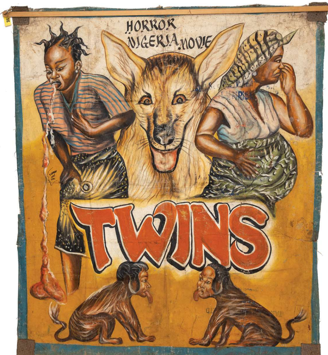
Boven: Twins (Nigeria, jaartal onbekend). Gesigneerd T-Brew Art, Takoradi (Kwesi Blue), 136 x 117 cm.