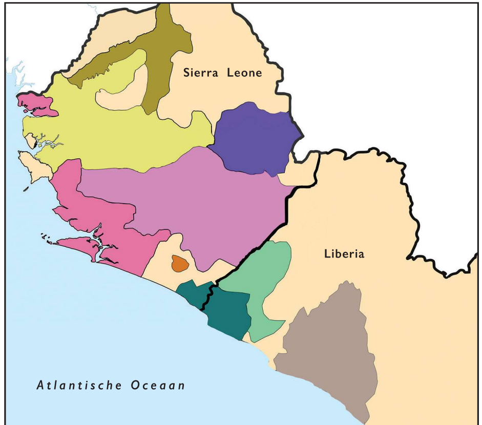
De woongebieden in Sierra Leone en Liberia van de volken waaronder het Sande genootschap was verspreid.