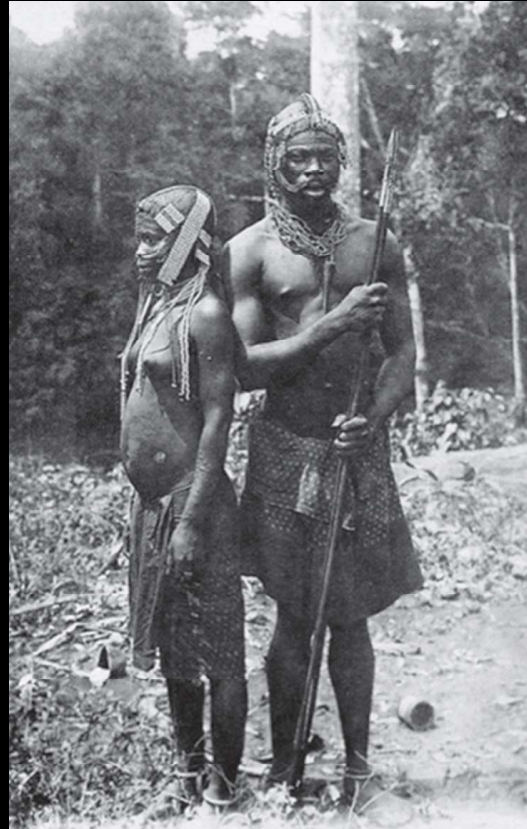
Foto boven: Vrouw en man van de Fang.

Het betalen van een bruidsschat behoort bij de Fang tot de normen en waarden. Het kan echter zo'n dure aangelegenheid worden dat er een andere manier wordt gezocht om met het meisje van je keuze te trouwen.