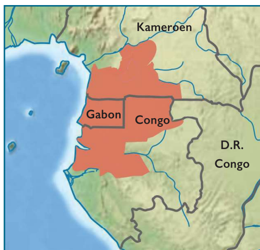
Leefgebied van de Fang.

Gedurende de verlovingsperiode, die wordt gezien als een proefperiode, verblijft de