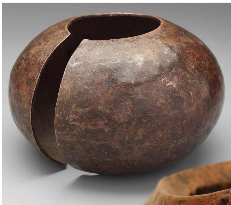
Ambi enkelband, 20ste eeuw, 21,6 x 12,7 cm. Coll. Boston Museum