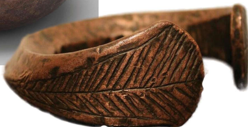
Rechts: Lokotshi, open versierde band, vaak van recenter datum.