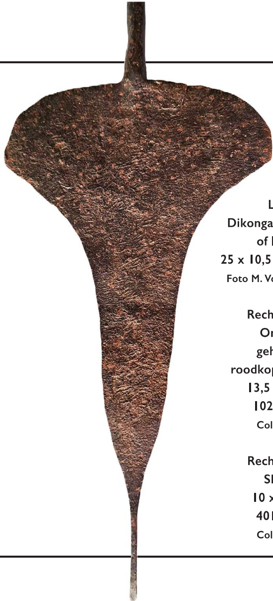
Links: Dikonga dia mpunga of Ikonga, 25 x 10,5 cm, 70 gram.