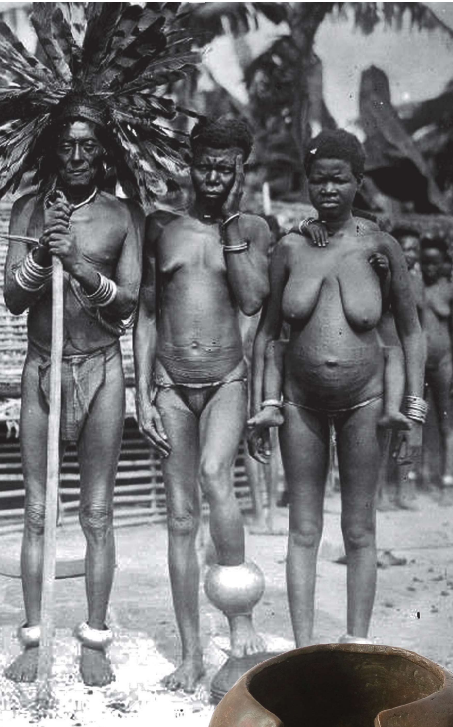
Diako, links een lage enkelband (12,5 x 6,5 cm en 715 gram), rechts een hoge (13 x 8,8 cm en 1397 gram). De diako wordt door mannen gedragen.

Het betalen van een bruidsschat is een wijd verbreid gebruik onder vele volken in Afrika, zo ook bij de Mbole, Jonga, Hamba, Nkutshu, Tetela en Mongo. Deze volken gebruiken vaak koperen voorwerpen als sieraad, betaalmiddel, voorwerp van aanzien en ook voor de bruidsschat. Ze worden gemaakt door de meester-smeden van de Jonga.