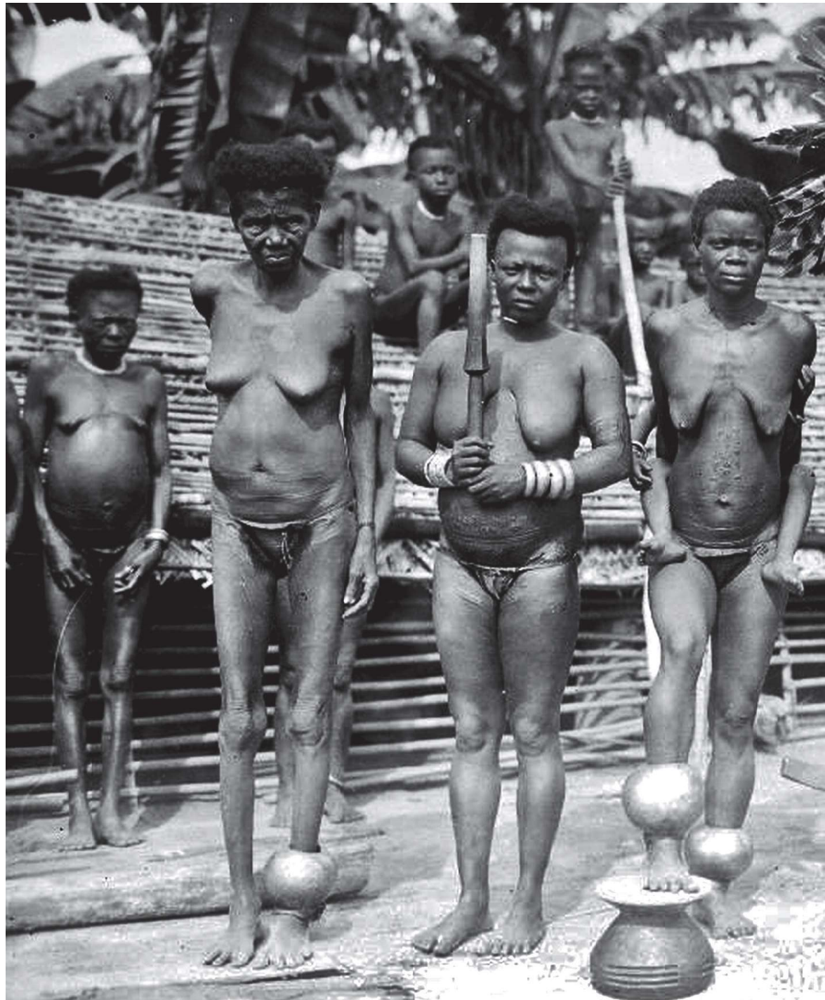
Mbole chieft met zijn vrouwen. De eerste vrouw draagt twee enkelbanden, de andere vrouwen een of geen. De foto is voor 1927 gemaakt.