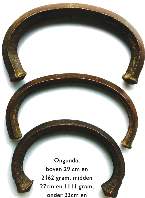
Ogunda, boven 29 cm en 2162 gram, midden 27cm en 1111 gram, onder 23cm en 1440 gram. Coll. auteur