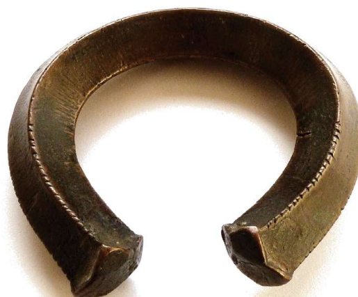
Rechtsonder: Shingu, 10 x 10 cm, 401 gram. Coll. auteur

juridische onderhandelingen verlopen onder zijn leiding. De vrouw betuigt haar instemming door een deel van de bruidsschat aan haar wettelijke vader te overhandigen.