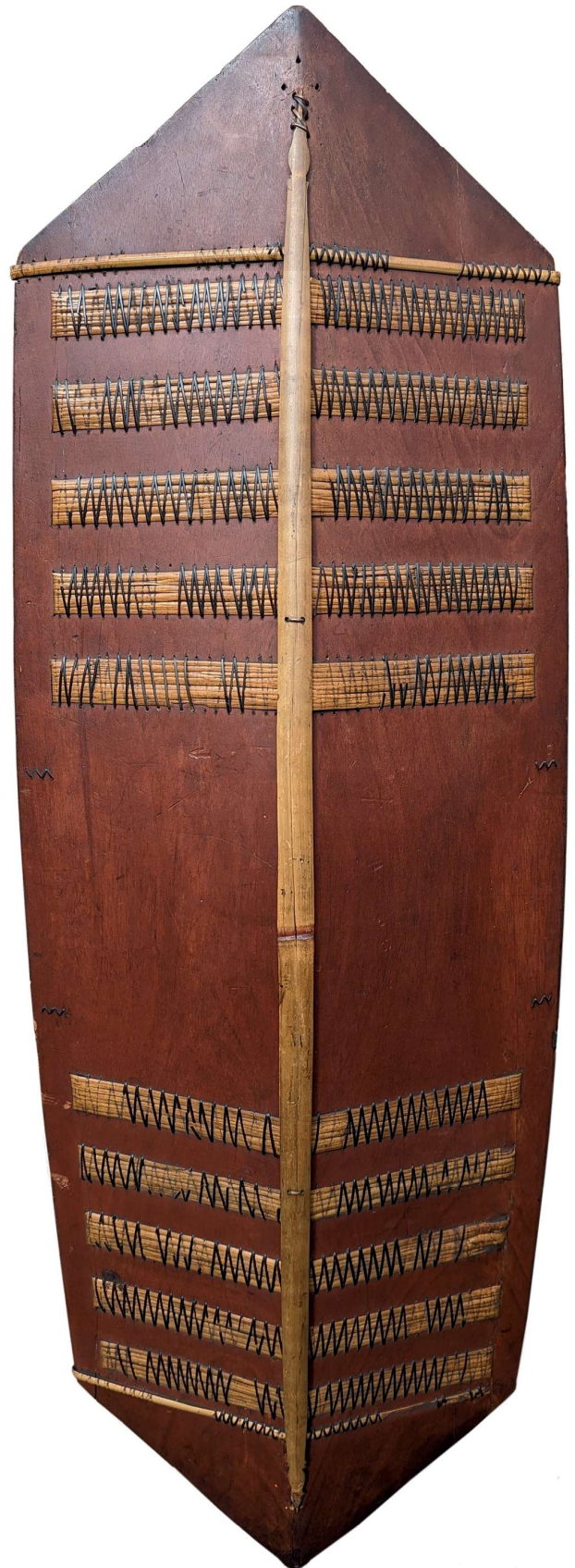
Een kliau, een zeshoekig Dayak-schild zonder versieringen, h 125 cm.

De belangrijkste krijgsattributen van de Dayak zijn: de blaaspijp ( sumbitan ) met gifpijltjes (zie artikel in Tribale kunst 2018-1), het persoonlijke zwaard ( mandau ) en het schild. De krijgerscultuur is ingrijpend gepacificeerd toen de koloniale overheden aan het einde van de negentiende eeuw en het begin van de twintigste eeuw het koppensnellen hadden weten te onderdrukken. Overigens zijn er gedurende de Tweede Wereldoorlog en de Maleise Opstand (1948-1960) nog ervaringen geweest van het koppensnellen, maar nu in dienst van de Britse kolonisator en gericht tegen diens opponenten. Ook tijdens een etnisch conflict in 2001 tussen geïmmigreerde Madurezen en de inheemse Dayak is sprake geweest van een vorm van koppensnellen door de Dayak. In beide laatstgenoemde gevallen was de context vanzelfsprekend verschillend van de periode waarin de Dayak het koppensnellen vooral onderling in de praktijk brachten. De uitvoering verschilde eveneens in verschillende opzichten, maar er lijkt toch sprake te zijn geweest van een verband met de oorspronkelijke koppensnellerscultuur.