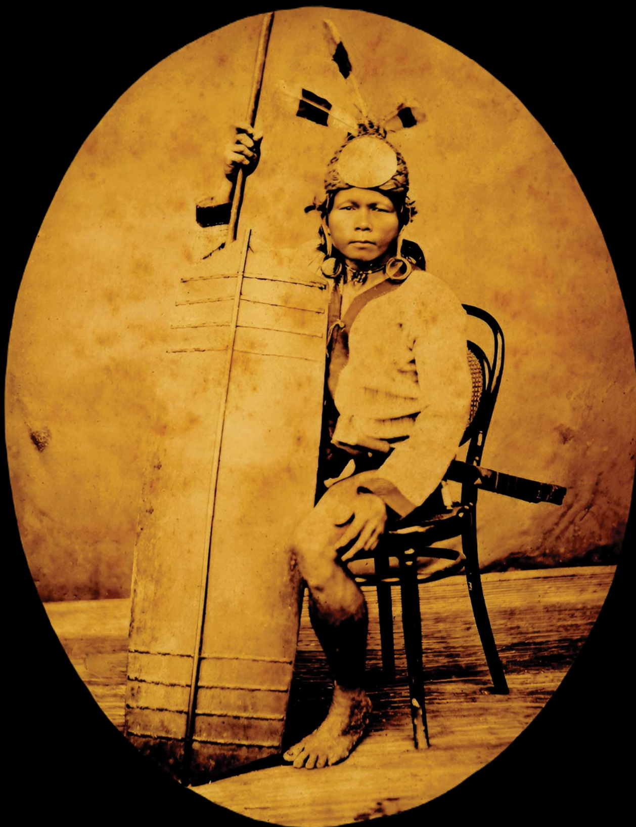
Dayakker in krijgsgewaad met zwaard, blaaspijp en schild, ca. 1883.