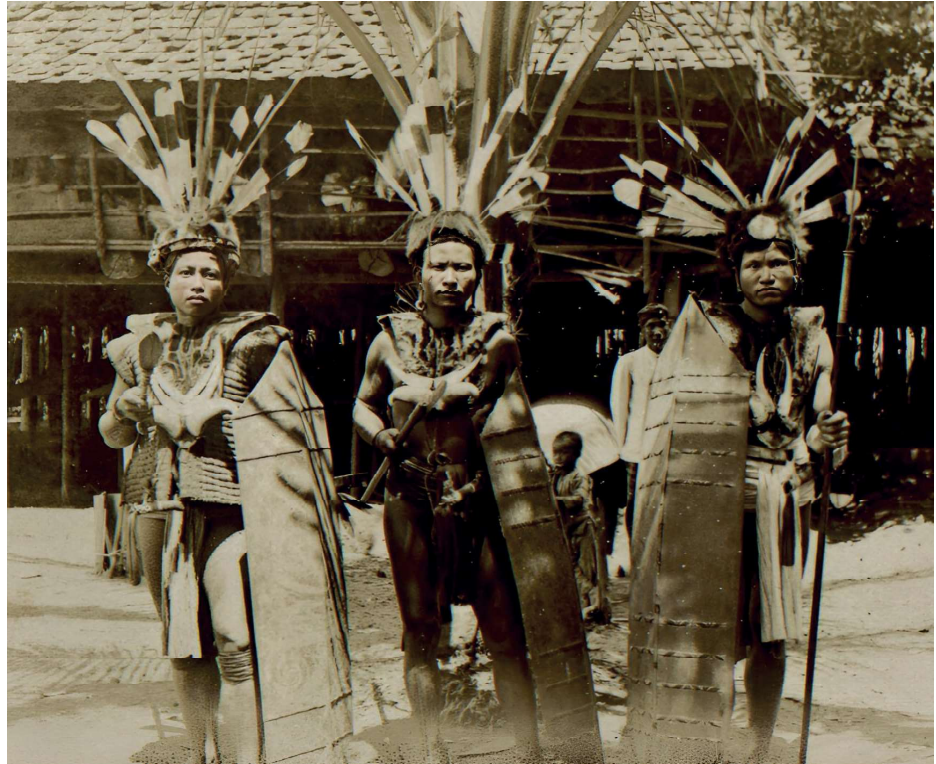
1915 Dayak Bahan Midden Borneo.

De Dayak krijger laadde zichzelf voor de strijd op met allerlei materiële en transcendentale bijstand. Strijd en koppensnellen waren bij de Dayak onderdeel van een veel groter spiritueel complex, waarbij steeds het juiste evenwicht van krachten moest worden gevonden. Het benodigde voorteken voor het vervaardigen van nieuwe schilden bij de Iban Dayak was de waarneming van een shamaliijster ( Copsychus malabaricus ). Beschouwd als een dier met 'koude' eigenschappen, werd deze waarneming onderdeel van de tegenkrachten voor de vele met strijd gepaard gaande 'hete' energie. Er werd geofferd aan de geestenwereld en de Iban trokken het bos in naar de verkozen boom. Driemaal werd er op de boom geslagen. Pas daarna mochten daarvan schilden worden gemaakt.