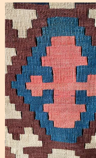
Rechtsboven: Een kilim van de Lori.