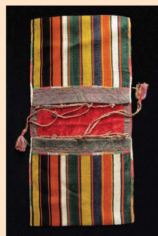
Een chanteh (sieradentasjes), waarin zowel mannen als vrouwen hun sieraden bewaarden.