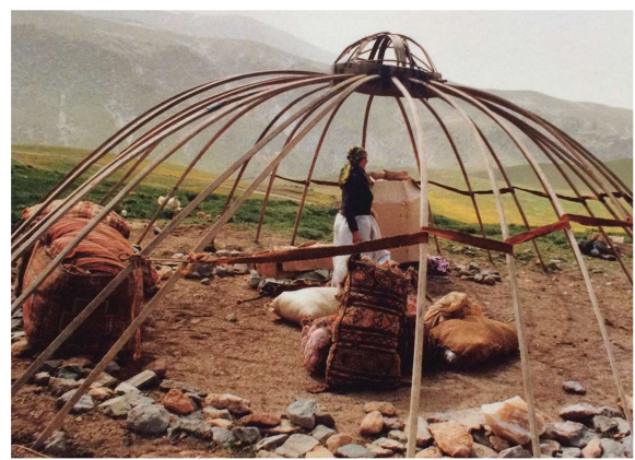
Links: De tent bestaat uit houten stokken met daar overheen vilt of geweven doeken.