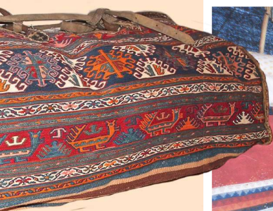
Onder: Overdag staat het slaapperief tegen de tentwand opgeslagen.