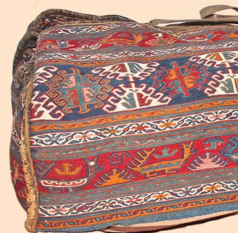
Onder: Een mafrash.