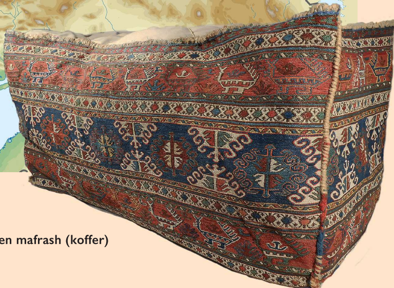
Een mafrash (koffer)

Al jaren verzamel ik nomadische weefsels, het door nomadische volken gemaakte textiel. Het overgrote deel van mijn collectie komt uit Iran en dan vooral van één confederatie van volken: de Shaksavan. Deze confederatie is gevestigd in het noordwesten van Iran en het zuiden van het huidige Azerbeidzjan. Zij, met vooral de Moghan, kregen mijn aandacht omwille van de fijnheid van hun gesponnen wol en de hoge kwaliteit van het kleuren van de wol. Zij worden daarom weleens de ‘Duitsers’ van de weefkunst genoemd.