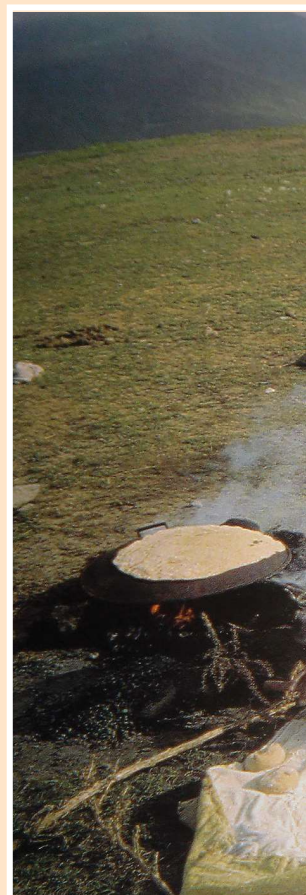
Brood werd buiten gebakken en in een sofreh (rechthoekige doek) 'ingepakt' om het vers te houden.

Deze semi-nomadische leefwijze had ook invloed op de weefnijverheid. Men ging in de dorpen steeds meer vaste weefgetouwen gebruiken en had daardoor de mogelijkheid bredere stukken te weven. Een volgende logische stap was dat men een enkele keer iets weefde op aanvraag, op bestelling. Zo ontstonden meer decoratieve kilims van groter formaat, door de klant gebruikt om de