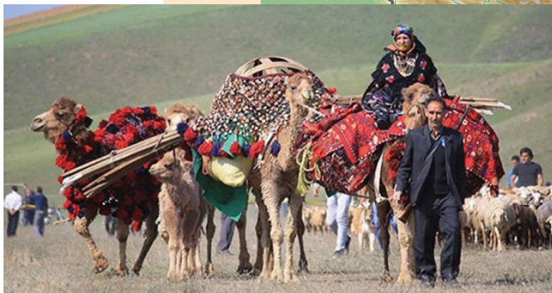
Boven: Een groep Qashqāi in het Zagros gebergte tussen Esfahan en Shiraz (Iran) onderweg naar hun volgende standplaats.

Op de kaart van Iran het leefgebied van de Shabsavan (blauwe cirkel) en dat van resp. de Qashqāi, Lori en Bakhtiari (paars).